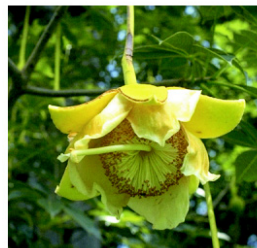
Figure 3. Fleur, feuille et fruits d' Adansonia digitata .

Mozambique, les populations d' A. digitata sont côtières ou dispersées dans les zones de basse altitude et dans la savane. En Angola et en Namibie elle est plutôt trouvée dans les régions boisées, tandis qu'au Zimbabwe et au nord de l'Afrique du Sud