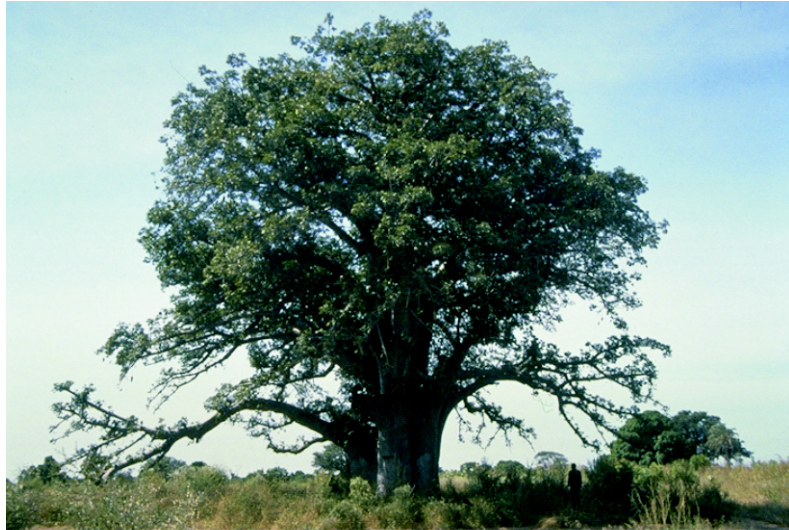
Figure 2. Vue d'ensemble d' Adansonia digitata .

A. digitata est indigène des steppes sahéliennes et des savanes soudano-sahéliennes [2, 4, 10]. Cette espèce de baobab est présente dans la plupart des régions semi-arides et subhumides du sud du Sahara ( figure 1 ). Elle est souvent localisée à proximité des habitations. La zone de distribution du baobab est très vaste. À l'Ouest, elle s'étend du Cap-Vert aux plaines côtières du Ghana, Bénin et Togo. Au Nord, elle est limitée par le Sahara. En Érythrée et en Somalie, l'arbre est typique des plaines, tandis qu'au Soudan il se développe dans les montagnes du Nouba et jusqu'à 1500 m d'altitude en Éthiopie. Au Kenya et plus au Sud vers le