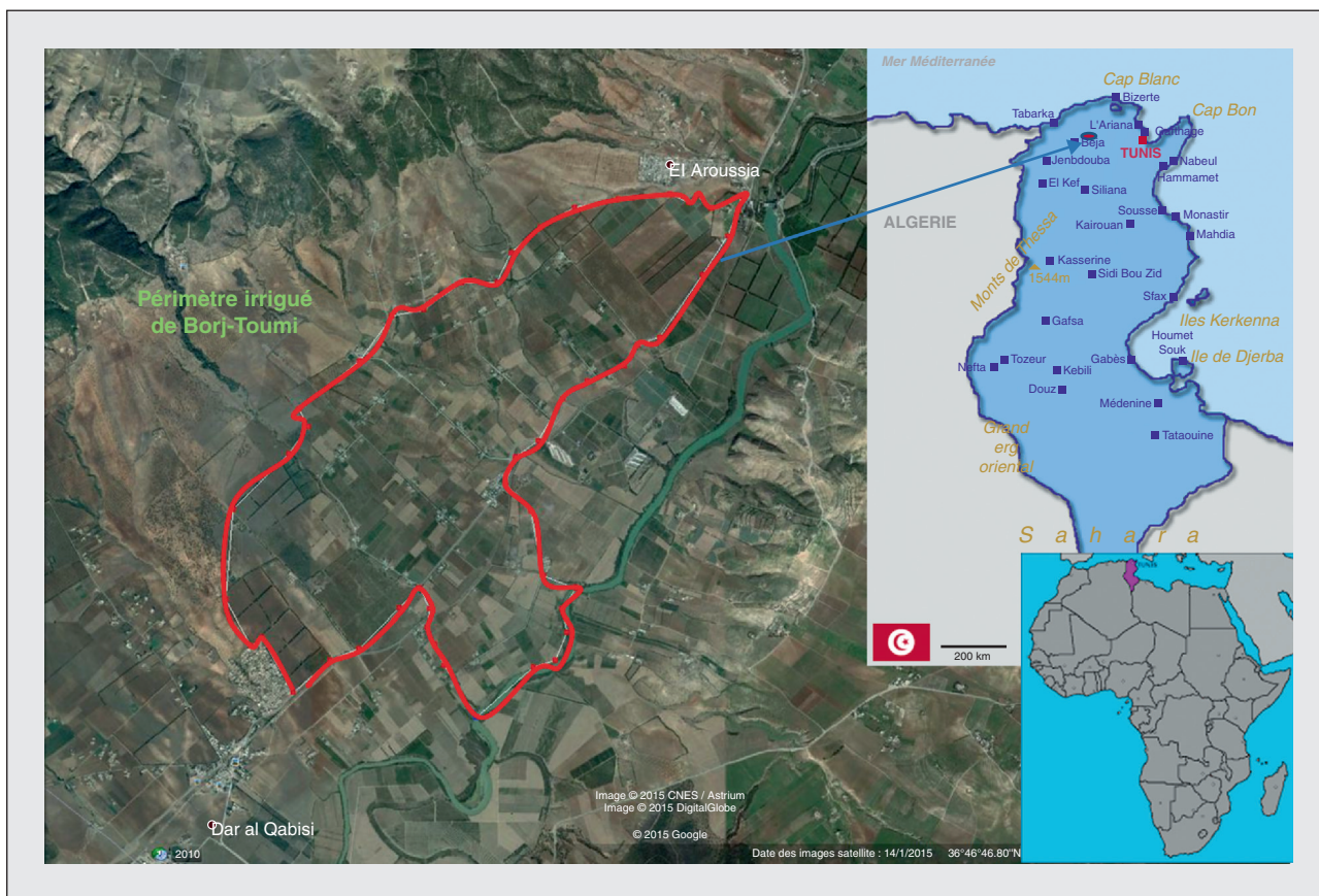
Figure 1. Localisation de la zone d'étude.