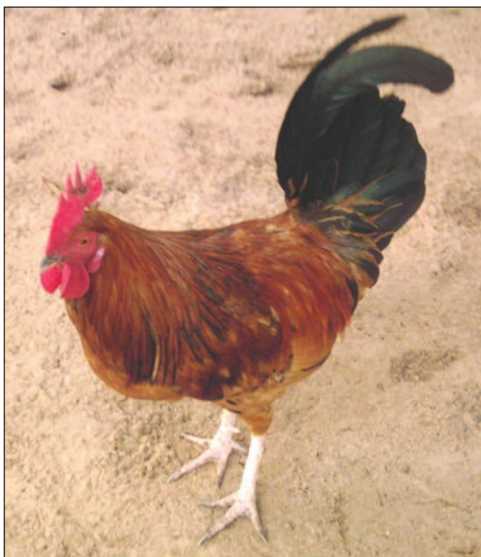
Figure 1. Coq rouge à queue noire présentant une crête simple de couleur rouge vif et aux tarsi blancs.

L'étude a été menée entre novembre 2006 et juillet 2007 dans deux zones agro-écologiques (forêt et savane) de Côte d'Ivoire. Situé en Afrique de l'Ouest, le pays s'étend entre 4° 30' et 10°30' de latitude Nord et entre 2°30' et 8°30' de longitude Ouest. La zone de forêt, située au sud-est et représentée par les circonscriptions administratives d'Aboisso, Alépé et Agboville, est caractérisée par un climat attién de pluviométrie moyenne annuelle 1 600 mm et de température oscillant entre 26 °C et 32 °C. La zone de savane arborée située au centre-est couvrant Yamoussoukro, M'Bahiakro et Didiévi est caractérisée par un climat baouléen avec une pluviométrie