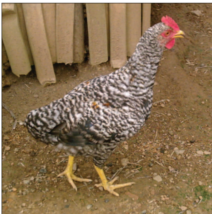
Figure 3. Coquelet argenté au plumage coucou présentant une crête simple de couleur rouge vif et aux tarsi jaunes.