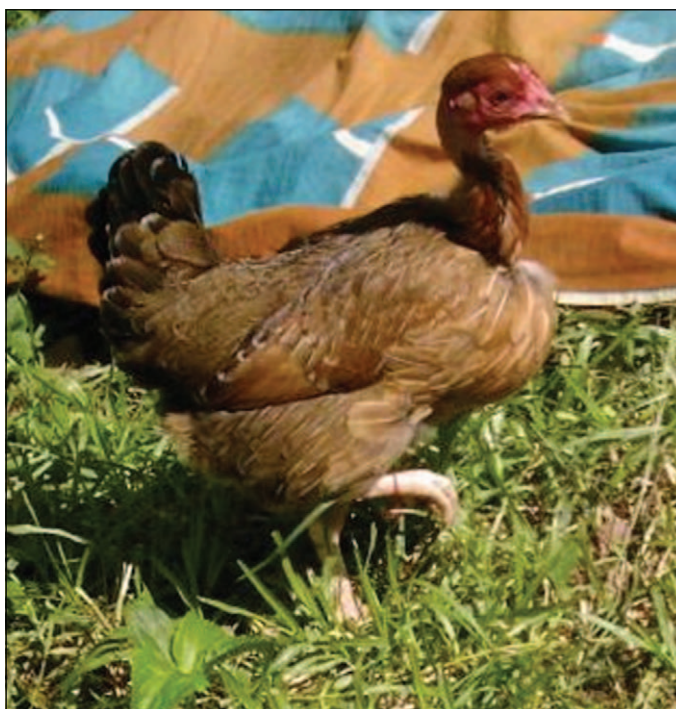
Figure 2. Poule au plumage « perdrix » doré à cou nu et à tarsi blancs.