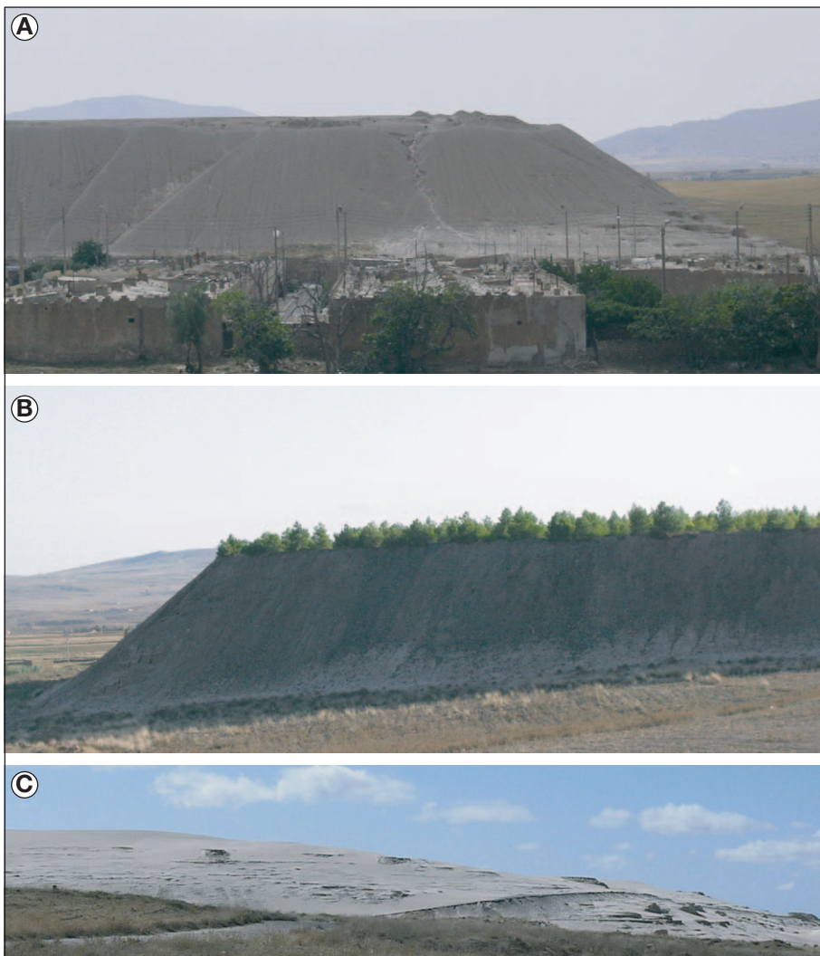
Figure 3. Sites de Touissit et Boubker.