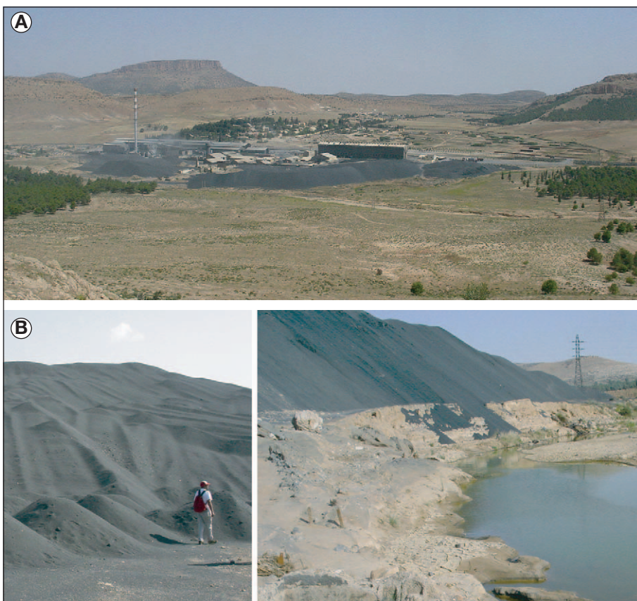
Figure 2. Description du site d'Oued El Heimer.