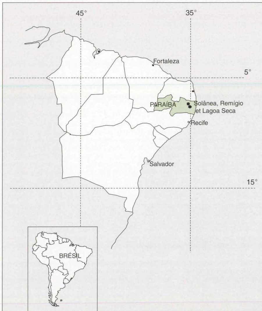
Figure 1. Localisation de l'Agreste de la Paraíba.

Cet article analyse les méthodes, les résultats et les limites d'un partenariat construit autour des processus d'innovation des agriculteurs. La question posée est celle de la validité et de la reproductibilité de dispositifs d'action collective capables d'assurer une coproduction de connaissances, voire d'innovations, entre agriculteurs et agronomes [6]. Quelle méthodologie d'intervention, au sens de David [7], peut-elle contribuer à l'émergence et au fonctionnement de groupes d'agriculteurs expérimentant en commun et en quoi la structuration de tels groupes favorise-t-elle une meilleure coproduction de savoirs ou d'innovations entre agriculteurs et techniciens. L'étude de cas a été réalisée à partir du suivi, de 1998 à 2000, de groupes d'agriculteurs des municípios 1 de Remígio, Solânea et Lagoa Seca (figure 1) qui se sont qualifiés eux-mêmes d'agriculteurs expérimentateurs, suite à un voyage d'étude au Nicaragua où ils ont connu le mouvement des agricultores experimentadores d'Amérique Centrale.