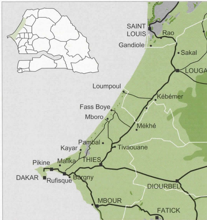
Figure 1. Situation de la région des Niayes.