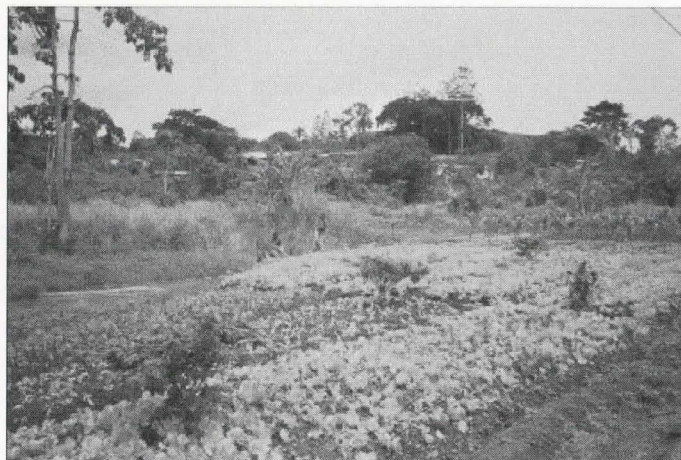
Photo 1. Agriculture périurbaine à Yaoundé.

Pour contribuer à répondre à cette question 1 , les caractéristiques systémiques de