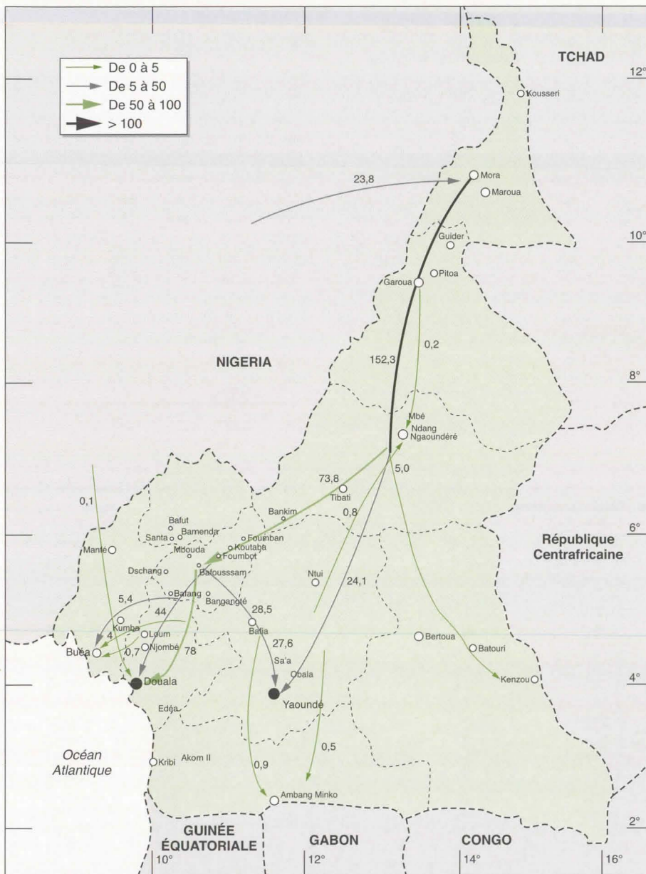
Figure 2. Quantification des flux de légumes (millions de CFA) au Cameroun en 1999.