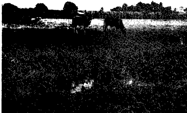
Photo 1 : Vue du secteur, bovins pâturent le long du canal de drainage.

Un premier foyer de fasciolose à Fasciola hepatica est rapporté en Guadeloupe. Lymnaea cubensis serait l'hôte intermédiaire. Des mesures sont proposées pour le circonscrire et l'éradiquer. Mots clés : Bovin - Fasciolose - Fasciola hepatica - Lymnaea cubensis - Guadeloupe.