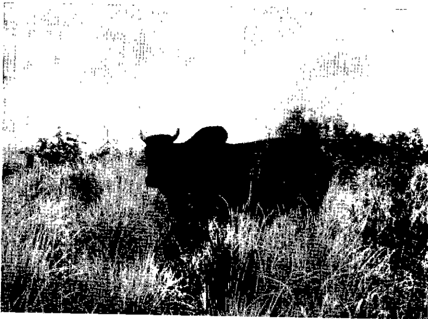
Nº 5. — Produits de croisement Brahman du Texas \times Zébu pulfuli au pâturage.