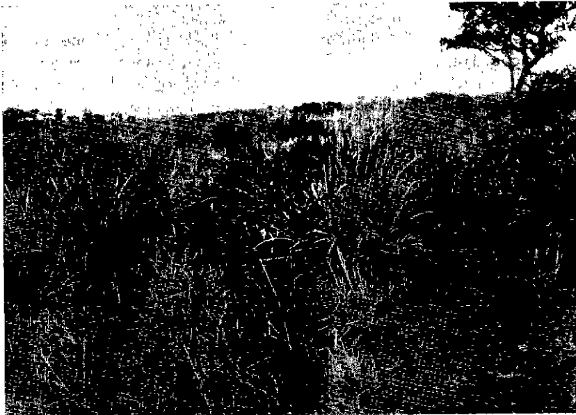
N° 9. — Dans des conditions de charge insuffisante (ici 250 kg à l'hectare en début de saison des pluies). Le Panicum phragmitoides constitue des refus importants.