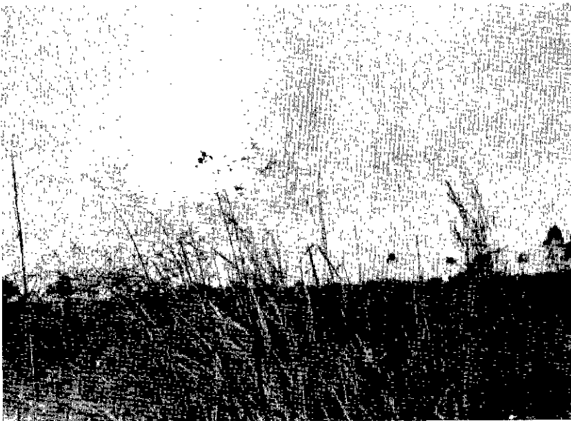
N° 8. — La pousse de Panicum phragmitoides prend vite les animaux de vitesse en début de saison des pluies.