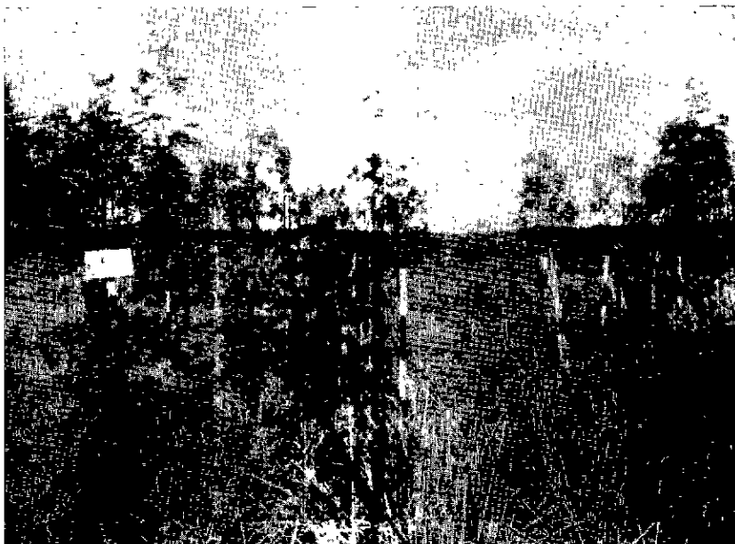
N° 1. — Un groupe de 6 placeaux d'étude du meilleur temps de repos.