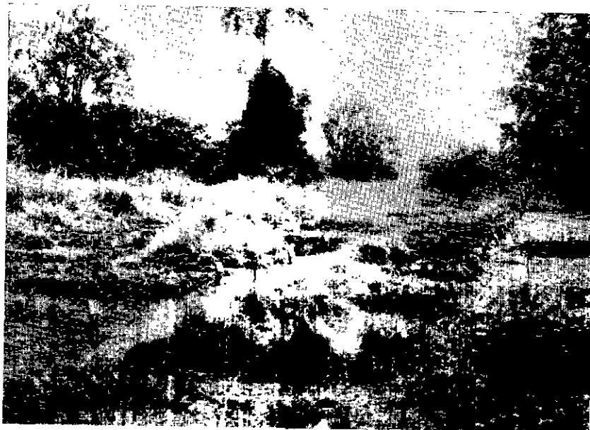
Nº 6. — Le jardin botanique en cours de réaménagement.