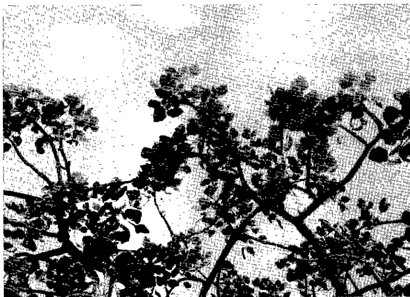
N° 3. — Erythrina sigmaidea .