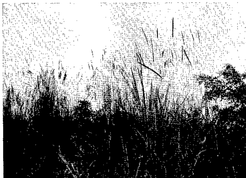
N° 4. — Setaria sphacelata petite variété en fin de floraison (mi-juin 65).