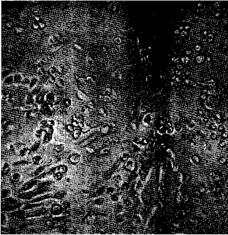
Fig. 1. — Cellules testiculaires ovines infectées par virus RIB (sans coloration) Microscope Zeiss, obj. 10/0,22, ocul. Kpl 8 ×