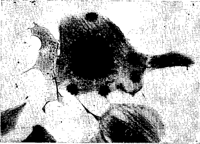
Fig. 5. — Cellule testiculaire ovine infectée par virus RIB ; inclusions intracytoplasmiques (hémalun-éosine) Microscope Zeiss, obj. Néofluar 40/0,75, ocul. Kpl 8 ×

inoculés avec une culture de cellules normales et les sérums de bovins normaux n'ont aucun pouvoir protecteur vis-à-vis de ce virus.