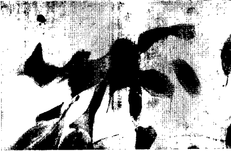
Fig. 3. — Cellules testiculaires ovines infectées par virus RIB ; noyau pycnotique et inclusions intracytoplasmiques (hémalun-éosine) Microscope Zeiss, obj. Neofluar 16/0,40, ocul. Kpl. 8 ×