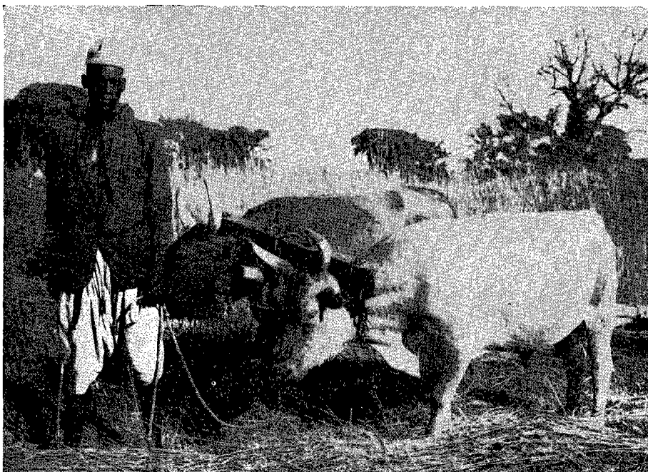
Fig. 5. — Dispositif d'attelage joug de bosse-timon.

et d'une robustesse exceptionnelles, qualités très importantes en Afrique. Le polyculteur donne satisfaction mais l'ensemble revient cher et quelques modifications doivent être apportées au modèle original. Nous avons dû déplacer le point de fixation de la charrue afin que le bœuf de droite puisse suivre le sillon et la souleveuse d'arachides s'avère inutilisable dans nos sols durcissant en début de saison sèche.