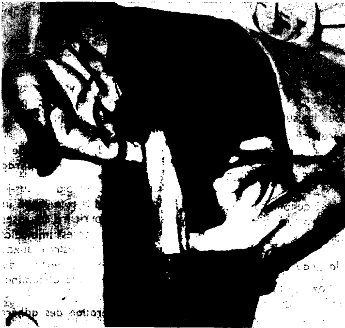
Fig. 4. — Isolement de la 12 e côte.

Locale uniquement, avec une solution de scurocaïne à 2 p. 100 adrénalinée. On injecte 2 ml en avant de la tête de la 12 e côte, 2 ml en arrière,