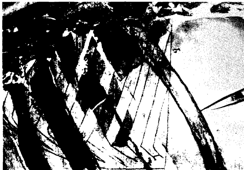
Fig. 1. — En arrière et en haut de la 11 e côte, la flèche indique le pédicule vasculaire de la rate.

— par la projection du pédicule vasculaire de la rate sur cette même paroi (Fig. 1).