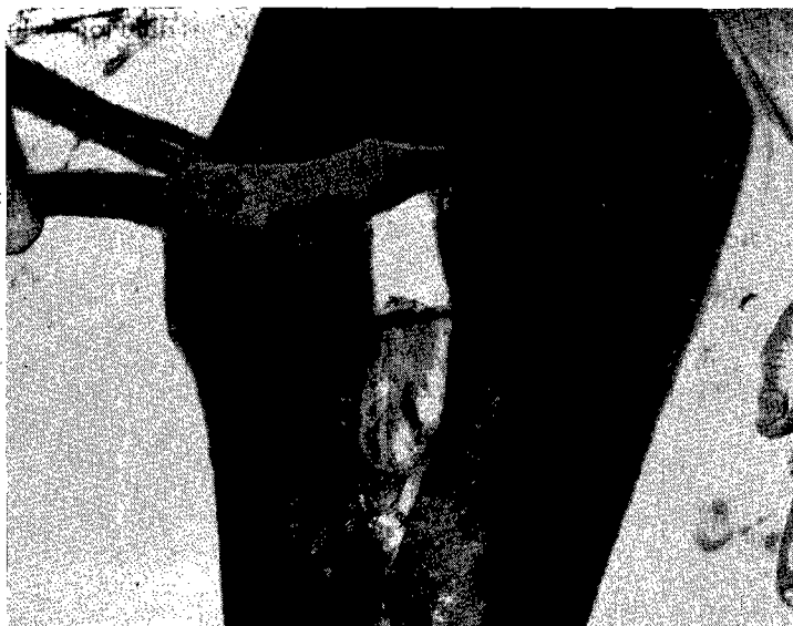
Fig. 5. — Section de la 12 e côte.

et l'on pratique une infiltration traçante sur l'axe de la côte.