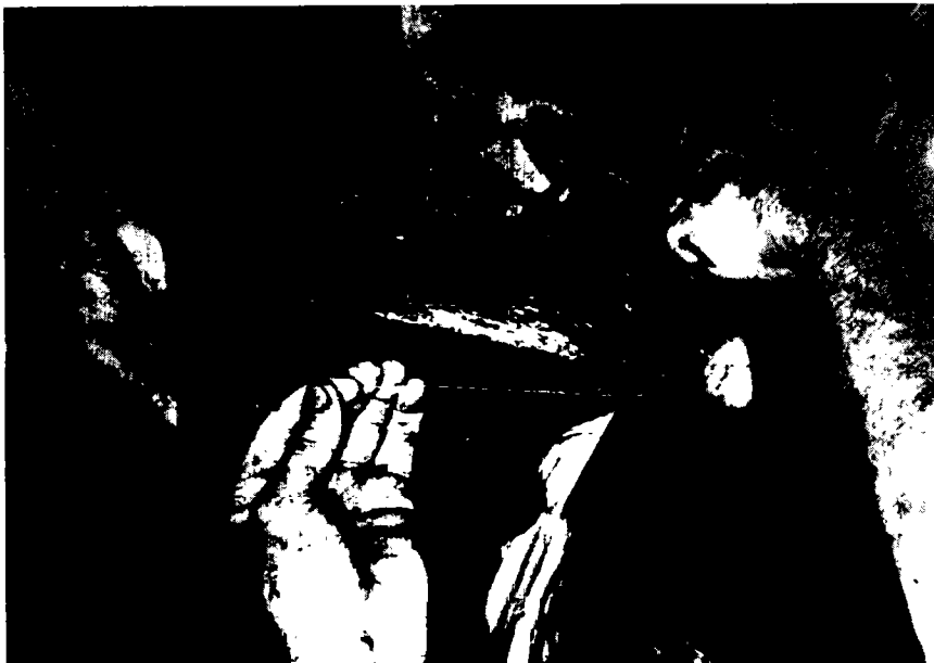
Fig. 7. — Ligature du pédicule de la rate.