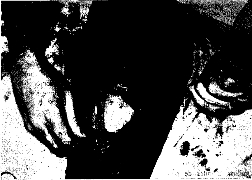
Fig. 6. — Suture du diaphragme à la paroi.