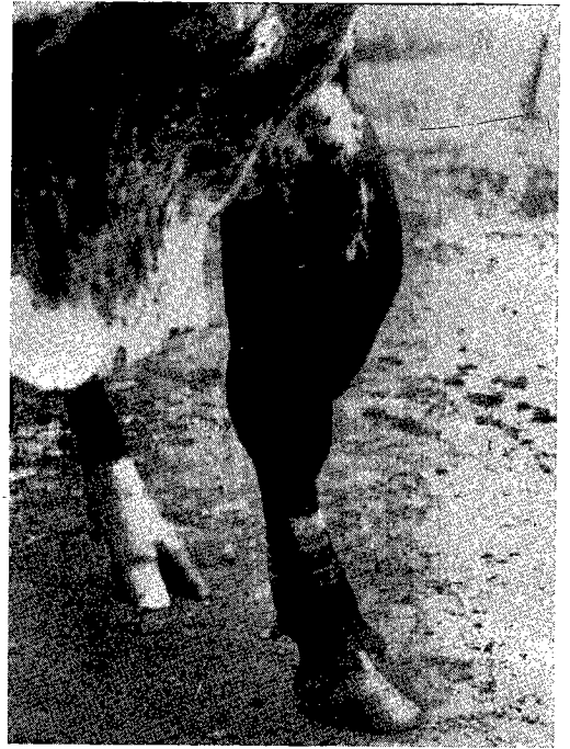
Phot. 2. — Enorme hygroma de l'avant-bras.