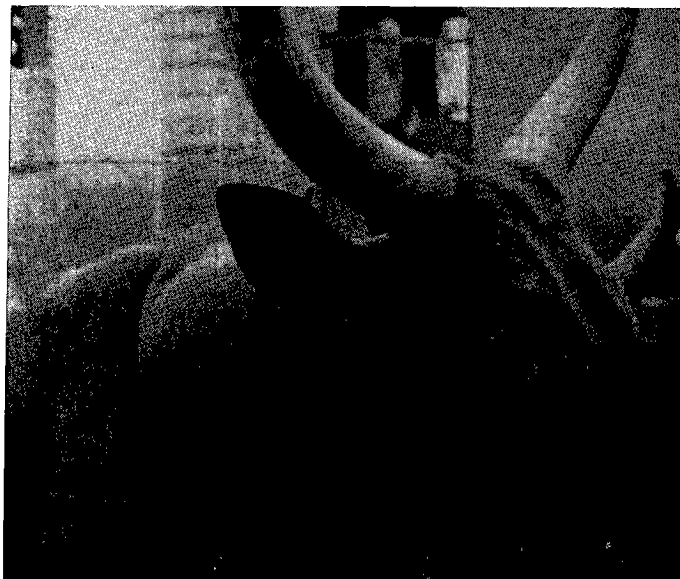
Phot. 3. — Hygroma entre les deux ligaments de la nuque.