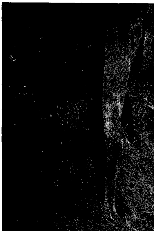
Phot. 5. — Hygromas au niveau des deux jarrets et du grasset gauche.