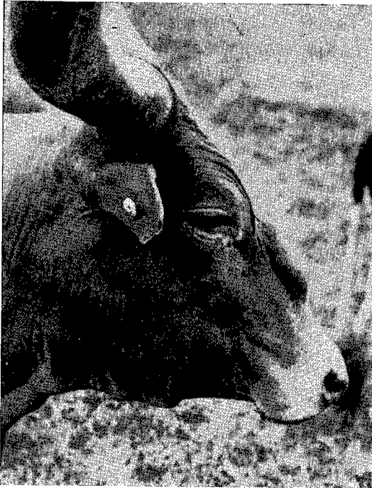
Phot. 1. — Hygroma au niveau du chanfrein.