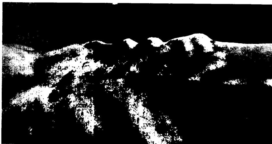
Phot. 6. — Absès brucelliques sous-cutanés.