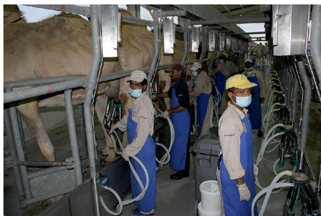
Figure 3 : Salle de traite de la ferme « Camelicious » à Dubaï et son personnel salarié abondant /// Milking parlour at the “Camelicious” farm in Dubai and its abundant salaried staff