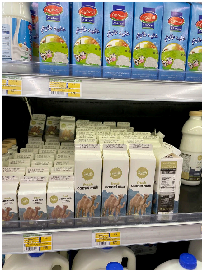
Figure 1 : Berlingots de lait de chamelle pasteurisé (un litre et un demi-litre) dans le linéaire « produits laitiers » du supermarché Carrefour à Salalah // Carton of pasteurized camel milk (one liter and half a liter) in the “dairy products” section of the Carrefour supermarket in Salalah

Ainsi, et même si cette « marchandisation » du lait de chamelle (Faye, 2019) apparaît particulièrement récente dans la région et qu'elle ne concerne qu'une petite partie du lait disponible localement, le processus interroge tant sur le plan conceptuel que pratique. Autrement dit, comment est-on passé en quelques années d'une « économie du don », à une « économie marchande » ? Avant de tenter d'apporter diverses réponses, il convient de revenir sur les concepts théoriques qui sous-tendent la compréhension de ce passage.