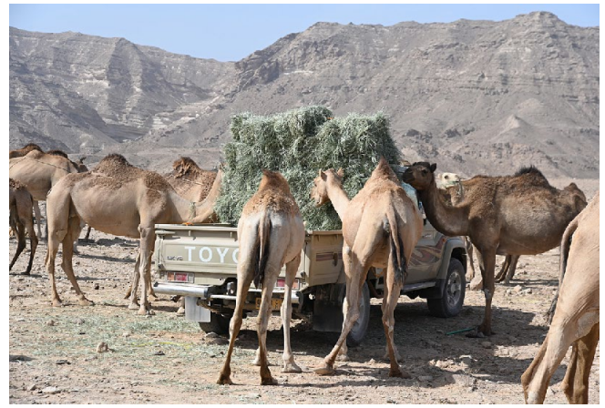
Figure 2 : Distribution de Chloris gayana (herbe de Rhodes) provenant de cultures irriguées à un troupeau de chamelles dans le Dhofar, Oman /// Distribution of Chloris gayana (Rhodes grass) from irrigated crops to a herd of camels in Dhofar, Oman

Cependant, une telle configuration est entrée en crise dès les années 1990. Bien que sédentarisés pour la plupart, les ex-nomades n'ont pas abandonné leurs chameaux et même, grâce aux revenus tirés des activités dans le secteur public ou privé, ont accru leur cheptel : entre 2004 et 2019, la population cameline du Dhofar est passée de 54 à 165 milliers de têtes. Or, avec la pression foncière en lien avec la sédentarisation, l'urbanisation et le développement du tourisme, et surtout l'augmentation considérable des effectifs animaux, les ressources naturelles ont cessé de couvrir les besoins des animaux (pas seulement les camelins). L'augmentation de la charge animale a contribué au surpâturage et à la détérioration des ressources pastorales, forçant les éleveurs à acheter des fourrages irrigués (essentiellement de l'herbe de Rhodes – Chloris gayana – produite dans les zones désertiques de la région de Wubar, au nord du Dhofar) et divers concentrés du commerce produits localement ou importés pour couvrir les besoins du cheptel. Dès lors, les éleveurs sont devenus dépendants de commodités renchérissant considérablement leurs coûts de production (figure 2).