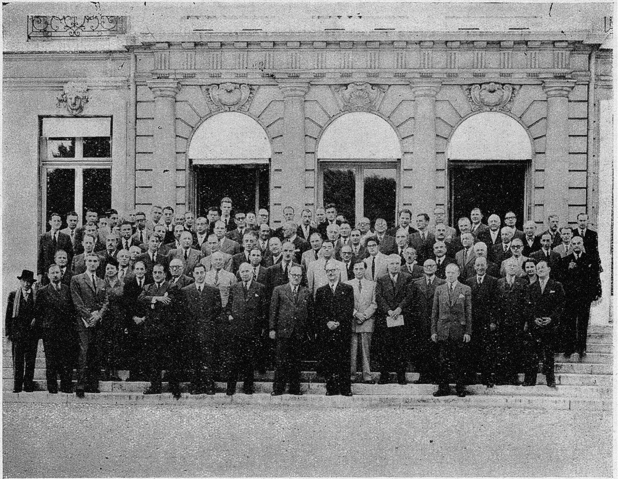
Séance d'inauguration du Congrès International des Bois Tropicaux, Paris, château de la Muette, 25 septembre 1951

tion des Syndicats locaux de producteurs et industriels en bois coloniaux, présenta ensuite son rapport d'ensemble, dans lequel il préconisa la vente au mètre cube comme la manière la plus judicieuse de satisfaire tous les intérêts en cause.