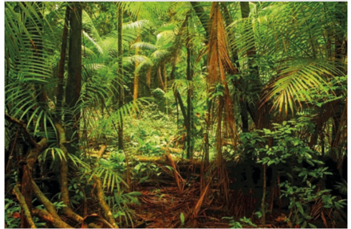
Photo 1. Une parcelle forestière près de Paracou en Guyane française. Ce site, ainsi que 14 autres sites du réseau TmFO à travers l'Amazonie, a été exploité à des fins expérimentales et la dynamique post-exploitation a été suivie dans des parcelles d'inventaire forestier permanent (845 ha à travers l'Amazonie dans son ensemble, pendant 10 à 35 ans). Les données de surveillance ont été utilisées pour calibrer les modèles développés pour cette thèse.