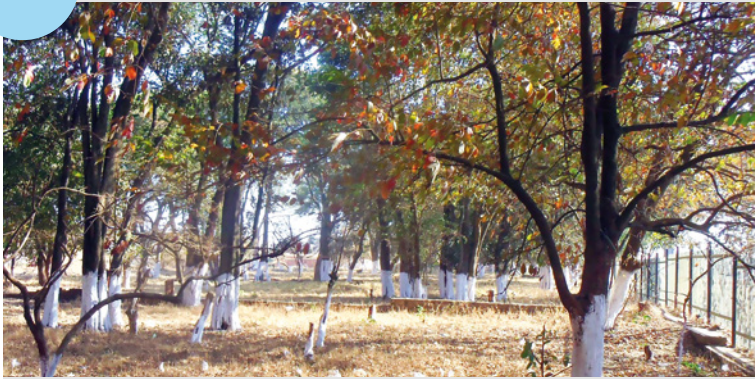
Photo 1. Vestige de la forêt claire de miombo dans la zone périurbaine de Lubumbashi. Les espèces végétales dominantes sur cet espace sont Marquesia macroura Gilg. (Dipterocarpaceae), Combretum collinum Fresen. (Combretaceae), Diplorhynchus condylocarpon (Müll. Arg.) Pichon (Apocynaceae), Parinari curatellifolia Planch. ex Benth. (Chrysobalanaceae) et Brachystegia spiciformis Benth. (Fabaceae, Caesalpinioideae).