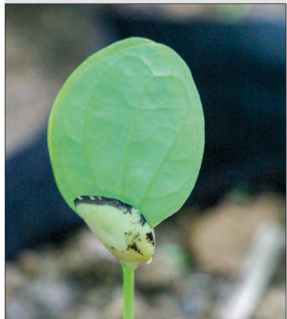
Foto 2. Plántula de Guibourtia tessmannii (especie inscrita en el anexo 2 de la CITES).

Photo 2. Seedling of Guibourtia tessmannii (species listed in CITES Appendix II).