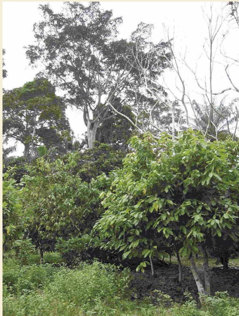
Photo 1. Agroforêt à base de cacao de la zone d'Obala.

Philippe PÉDELAHORE Cirad UMR Innovation TAC-85/15 73, rue Jean-François Breton 34398 Montpellier Cedex 5 France