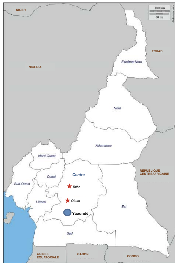
Figure 1. Localisation des zones d'Obala et de Talba.

La première s'étend sur l'arrondissement d'Obala (figure 1), situé dans le département de La Lékié. Cet arrondissement de 470 km 2 est situé à 40 km au Nord de Yaoundé. Il est relié à la capitale par une route goudronnée en bon état. C'est une zone cacaoyère ancienne et densément peuplée (> 100 habitants/km 2 ) (PNUD, 2000). Les habitants relèvent quasi exclusivement de l'ethnie autochtone Eton, et tous les planteurs interrogés appartiennent à cette ethnie. Les cacaoyères existantes dans cette zone ont généralement plus de 50 ans, même si les pratiques techniques conduisent à un remplacement progressif et constant des pieds les plus âgés (Jagoret, 2011). Les systèmes agroforestiers de cette zone sont des systèmes complexes et multistrates qui représentent bien l'archétype de la cacaoculture camerounaise décrite en introduction.