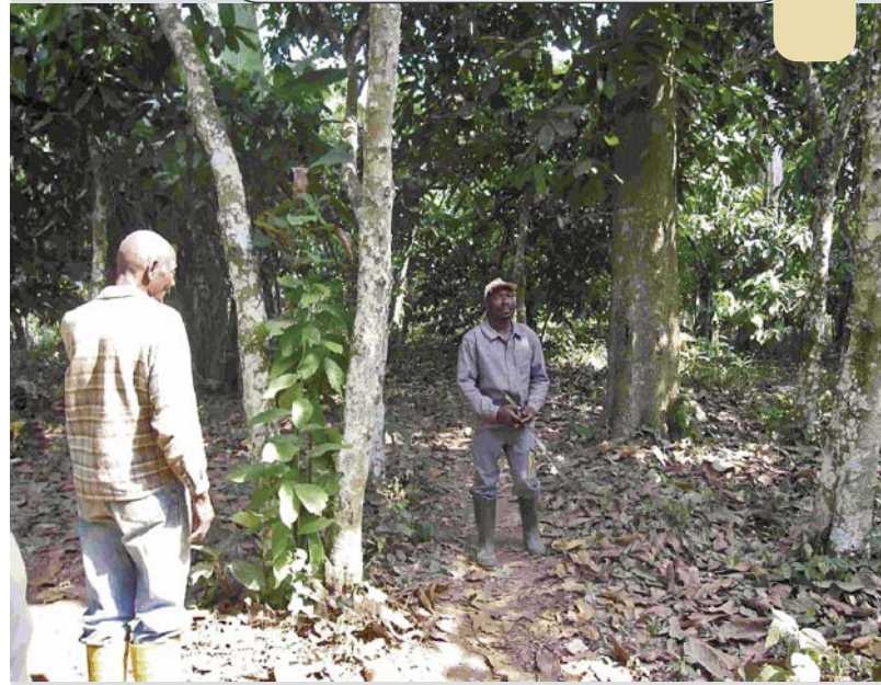
Photo 2. Agroforêt à base de cacao de la zone d'Obala.