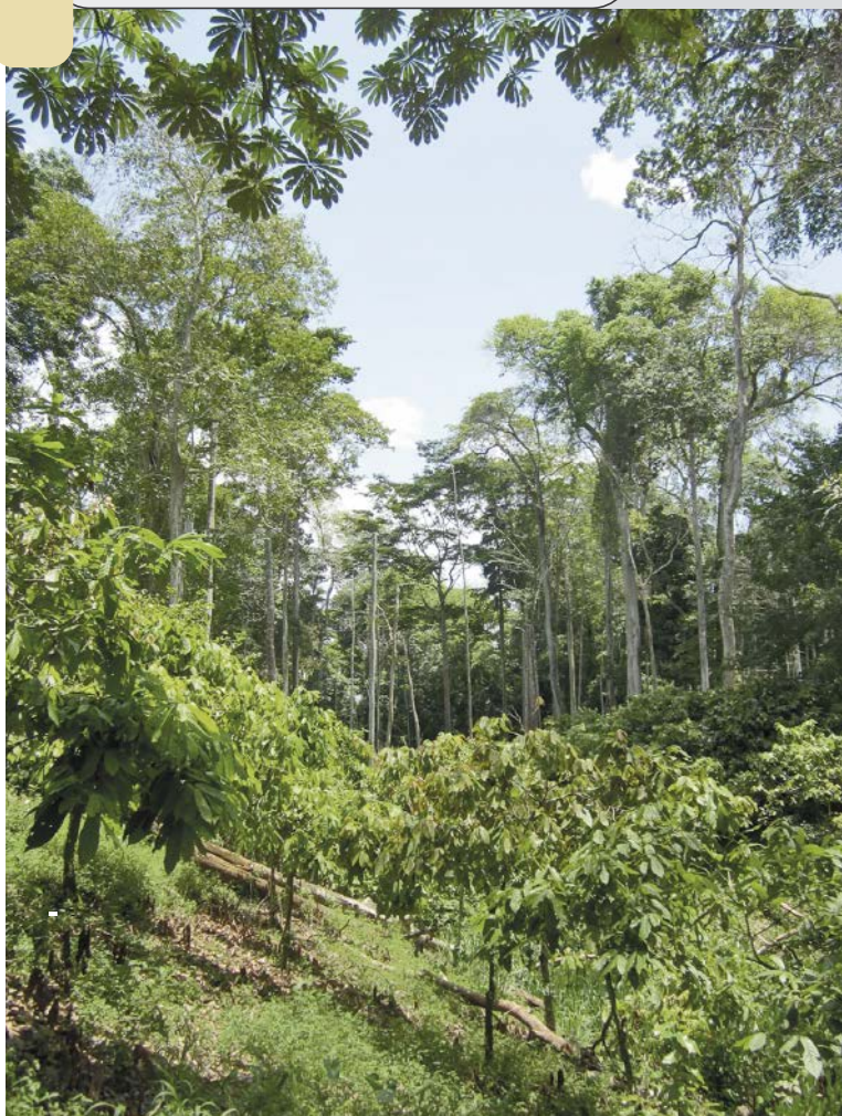
Photo 3. Agroforêt à base de cacao de la zone de Talba.

Cependant, dans la situation de la zone de Talba, la majorité des ouvriers agricoles viennent de la province du Nord-Ouest et n'ont pas été directement spoliés de leurs terres par les grands planteurs aujourd'hui installés dans la zone de Talba. Ces ouvriers agricoles sont venus chercher dans la zone de Talba des revenus monétaires plus importants que ceux auxquels ils pouvaient prétendre dans leur province d'origine. Certains d'entre eux parviendront d'ailleurs à se constituer une certaine épargne et à devenir « planteurs » à leur tour, même si leur nombre reste marginal. De même, les petits planteurs de la zone d'Obala ne sont pas contraints de venir louer leurs bras dans les grandes plantations cacaoyères de la zone de Talba. Nombre d'entre eux développent des activités non agricoles, souvent en milieu urbain (Pédelahore et al. , 2011), leur permettant de subvenir à leur besoins essentiels et de réussir parfois à développer leurs propres trajectoires d'accumulation. Enfin, la majorité des capitaux des grands et très grands planteurs proviennent d'activités non agricoles antérieures à l'installation de leurs plantations et à l'exploitation de la main-d'œuvre salariée agricole. Ainsi, même si l'on peut considérer que la zone de Talba connaît bien des