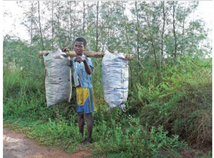
Photo 7. Dendrocalamus giganteus servant de support pour transporter deux sacs de charbon de bois.

Les autorités régionales sont conscientes de l'importance du rôle tenu par le bambou dans le développement économique de la région. À travers les intentions inscrites dans les planifications régionales de développement, le bambou occupe une place centrale et figure parmi les produits phares qui nécessitent une promotion. Selon les responsables de la région, cette relance devrait aller de pair avec les initiatives d'autres secteurs. Il y a nécessité de créer des attractions pour que la ville de Toamasina ne constitue pas seulement un endroit de passage pour les touristes, qui croissent significativement ces dernières années. Si avant 2010 deux à trois bateaux de croisière débarquaient chaque année à Toamasina, cette capitale économique de Madagascar en reçoit actuellement jusqu'à dix. À cet effet, pour pouvoir saisir une telle opportunité, la commune urbaine de cette ville envisage de créer des infrastructures construites en bambou au bord de la mer pour en faire des points de vente d'articles de souvenir. Ainsi la connaissance des caractéristiques technologiques du bambou est-elle favorable à cette initiative de construction.