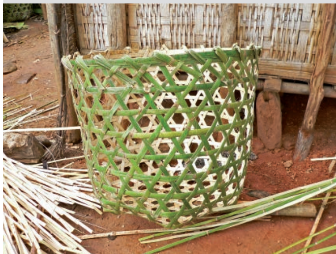
Photos 3. Fabrication artisanale de panier en Valiha diffusa .