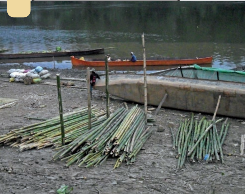
Photo 6. Embarcation de Bambusa vulgaris sur le fleuve Rianila à Brickaville.

Cette multiplicité des acteurs indique parfaitement l'importance socioéconomique de la filière, notamment dans la génération de revenus de plusieurs foyers. Par exemple, pour un agent professionnel spécialisé en tressage de plaque, la recette moyenne mensuelle générée par la transformation de bambou s'élève à 300 000 Ar (100 euros). Le chiffre d'affaires mensuel de la filière « tressage des plaques » atteint 1 680 000 euros, depuis l'abattage jusqu'à la commercialisation. Pour le cas de la société Madagascar Bamboo, les achats de bambous bruts procurent aux paysans une somme annuelle moyenne de 150 000 euros.