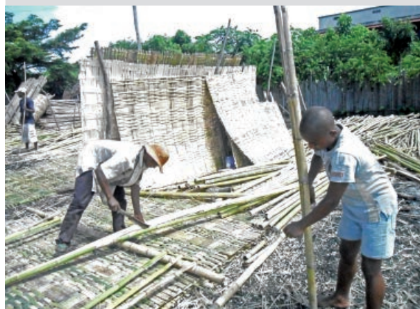
Photo 4. Entreprise artisanale de fabrication de revêtements muraux en Bambusa vulgaris . Les tiges sont découpées en lamelles puis tressées.

Un des points faibles dans la transformation des bambous est la non-valorisation des sous-produits. Dans les entreprises artisanales, les tiges inutilisées après la découpe et les copeaux de bambou sont jetés partout à terre (photo 4). Quelques vendeurs de gâteaux traditionnels (« mofogasy ») en récupèrent une partie pour s'en ser-