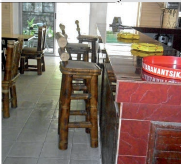
Photo 8. Utilisation du bambou, Dendrocalamus giganteus , en ameublement sous sa forme cylindrique.

Ces perspectives opérationnelles nécessitent la conduite d'activités de recherche. Cette étude a fourni des données de base sur les propriétés physiques et mécaniques des trois espèces de bambou de la région Est de Madagascar. Pour la suite, l'étude devra être complétée par celle d'autres propriétés telles que la durabilité naturelle et les propriétés énergétiques de ces bambous. Il est aussi recommandé d'étudier les propriétés des trois autres espèces de bambou poussant dans la région, de façon à proposer les essences appropriées pour chaque utilisation. Il serait également intéressant de mener une étude plus approfondie concernant la variabilité des propriétés intra-chaumes ainsi qu'une étude de l'effet du terrain et de l'âge sur les propriétés des chaumes. Ces travaux permettront d'appuyer les études sur la sylviculture des bambous, de déterminer l'âge optimal pour l'abattage des bambous et de proposer des techniques de transformation plus performantes. Enfin, la mise au point d'une colle naturelle pourrait permettre une valorisation sous forme de lamellés-collés ou de panneaux, de même que la mise au point locale de produits de préservation écologiques. Par ailleurs, il est nécessaire de cerner le potentiel disponible en bambous dans le territoire national et de conduire des recherches sur la multiplication des espèces.