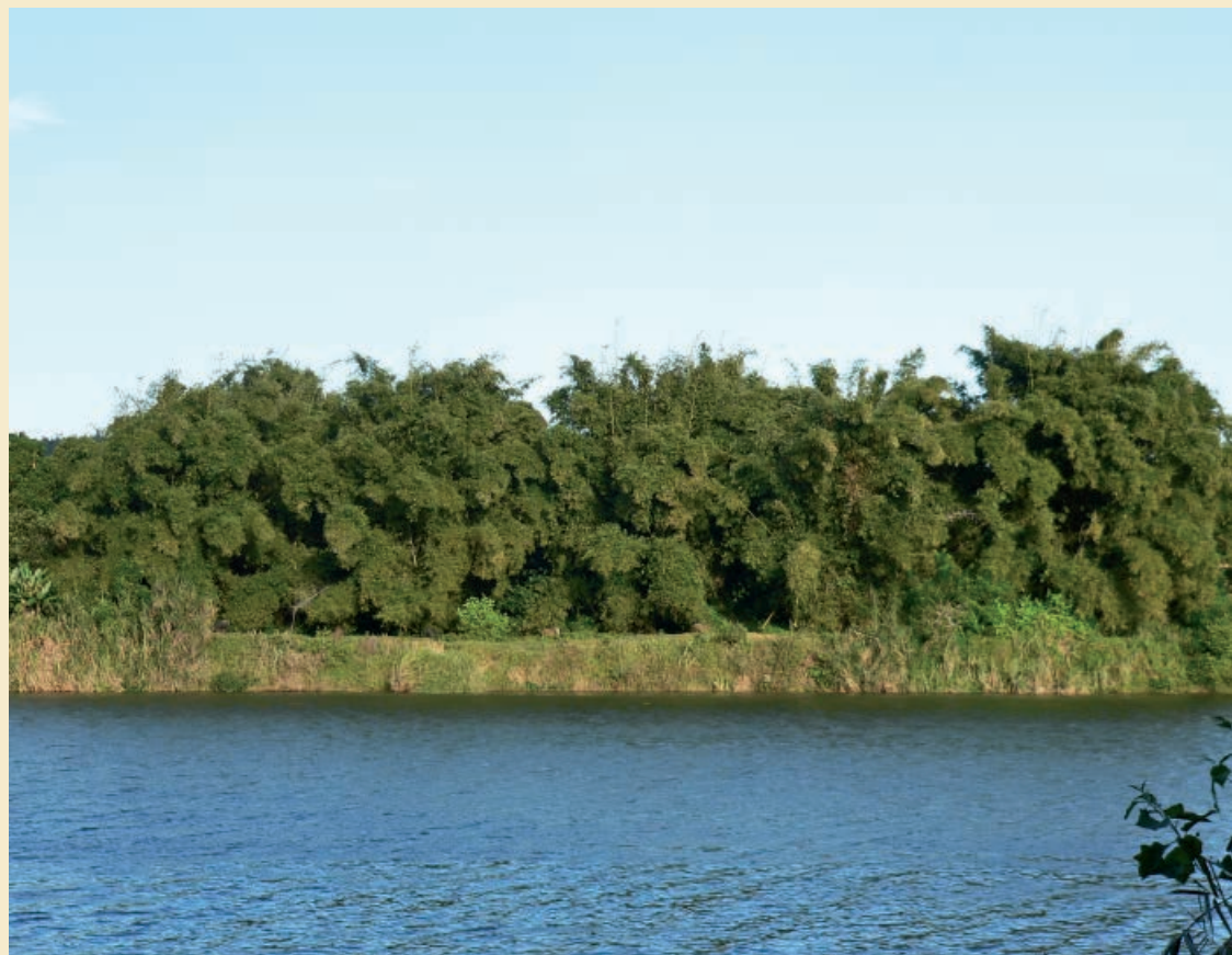
Photo 1. Ressources en Bambusa vulgaris le long du fleuve Rianila à Brickville.

2 Université de Bordeaux 1 Institut de mécanique et d'ingénierie Département Génie civil environnemental Bat. A11 BIS 351, cours de la libération 33400 Talence France