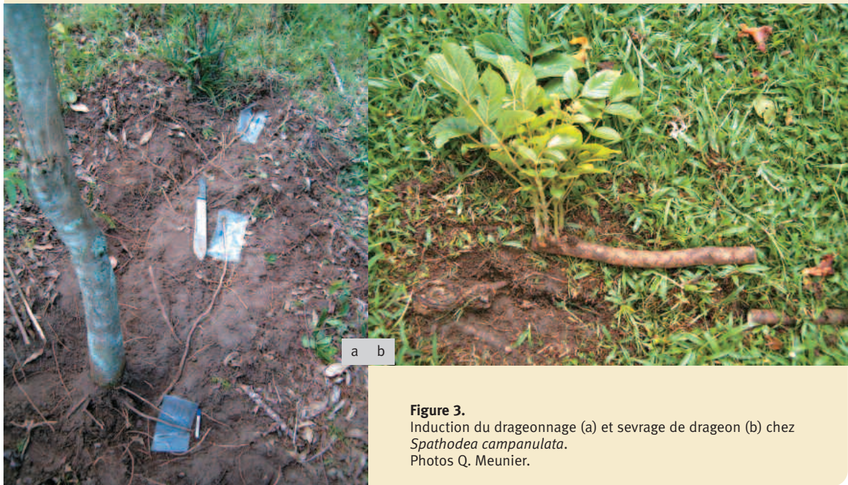
Figure 3. Induction du drageonnage (a) et sevrage de drageon (b) chez Spathodea campanulata .