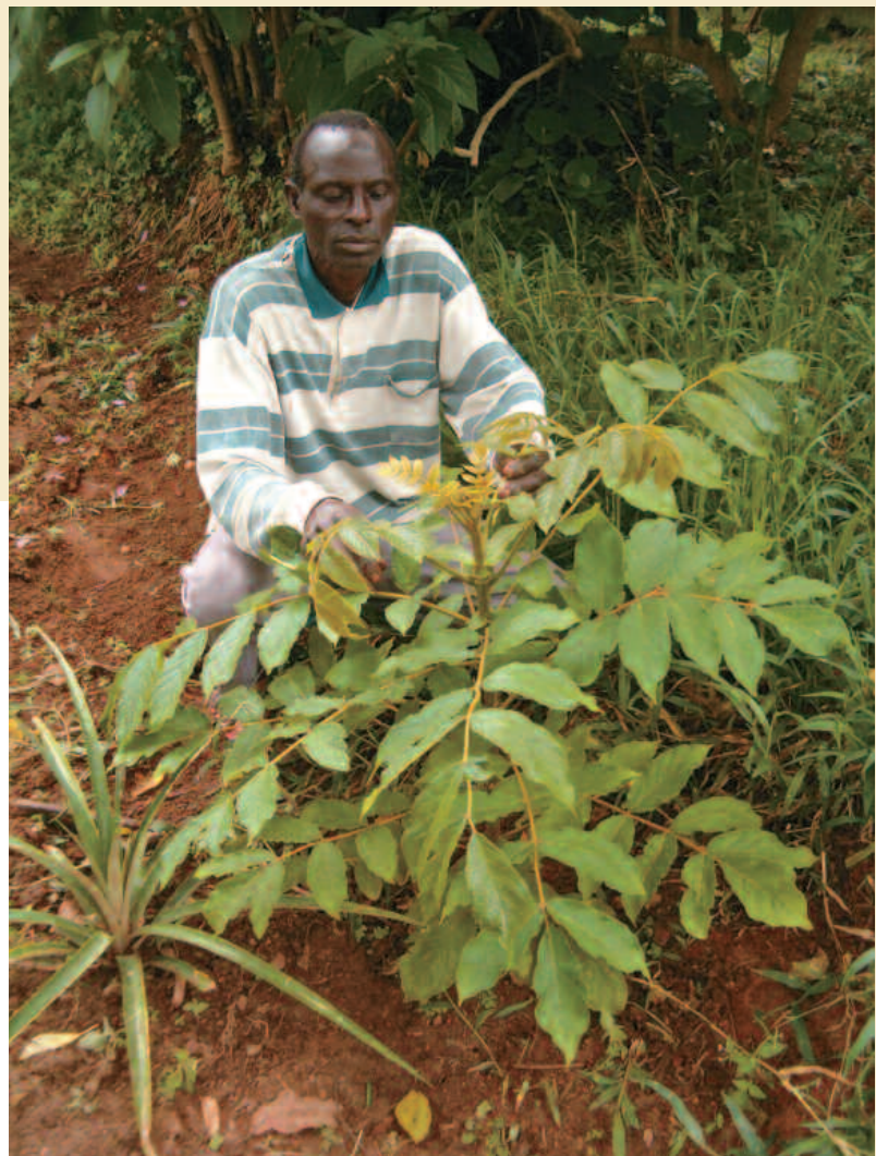
Transfert des techniques de multiplication végétative à faible coût aux populations locales : induction de drageonnage chez Spathodea campanulata .

Bushenyi, l'efficacité de diverses techniques a été testée pour la multiplication végétative de dix espèces ligneuses, utilisées à des fins médicinales par la population locale, lors d'un travail impliquant 60 agriculteurs et tradipraticiens. Ces techniques économiques représentent une alternative simple et peu coûteuse pour multiplier ces essences menacées. Un transfert de techniques a été effectué dans le cadre d'ateliers d'apprentissage. Des outils, des matériels adaptés ainsi qu'un guide technique ont été mis à disposition des partenaires locaux.