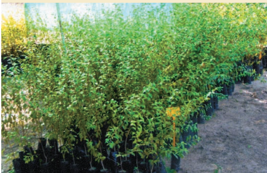
Plants de 4 mois issus de boutures adultes d'un an et de 6 mois (de gauche à droite), plantées dans des sachets en polyéthylène (12 cm de diamètre et 25 cm de hauteur).