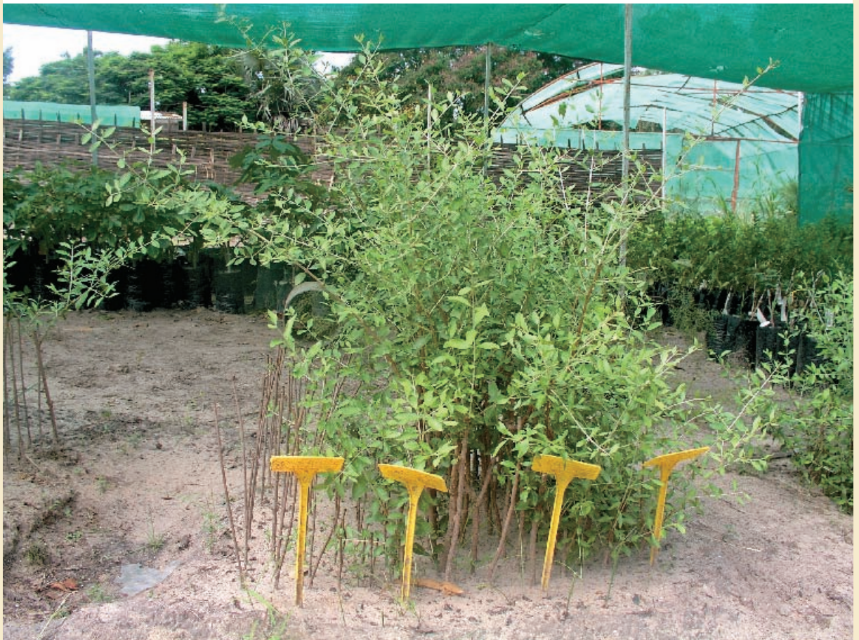
Plants de deux mois issus de boutures de type apical de 40 ou de 15 cm et de boutures de type basal de 40 ou de 15 cm.

Pour multiplier le henné , plante aux propriétés tinctoriales et médicinales, les populations sénégalaises n'utilisent que les graines. Néanmoins, le bouturage est possible mais les méthodes sont mal connues. L'étude présente les techniques de propagation mises au point au Sénégal, à partir de boutures de tiges de différents âges, types et longueurs. Les résultats seront utiles à la conservation du patrimoine génétique du henné ainsi qu'à sa valorisation dans des systèmes agroforestiers.