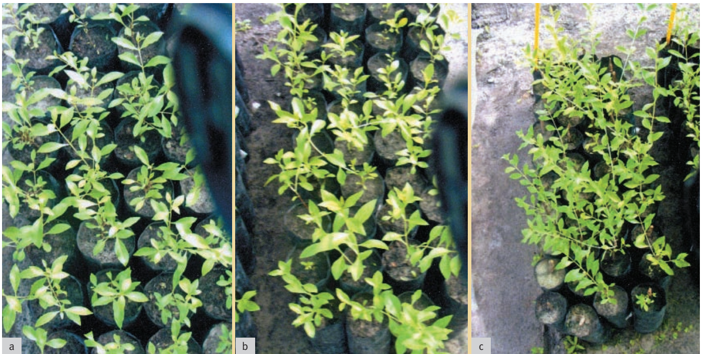
Plants de 1 mois issus de boutures de 6 mois (a), un an (b) et adultes (c) plantées dans des sachets en polyéthylène (12 cm de diamètre et 25 cm de hauteur).

Le bouturage des tiges a été effectué sur des rameaux peu lignifiés prélevés sur des jeunes plants de six mois et d'un an qui sont produits dans une pépinière du village. Des rameaux plus lignifiés ont été collectés au champ sur des plants de henné, indemnes de maladies, âgés de neuf ans. Ils sont prélevés aux