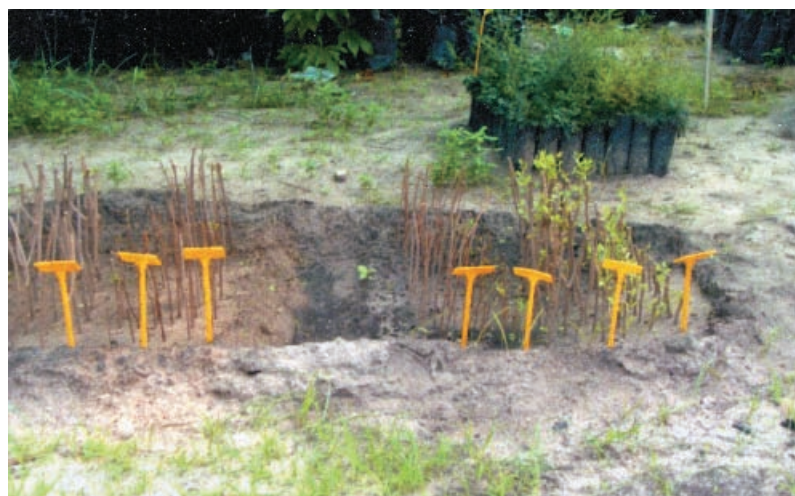
Plants de quelques jours en début de reprise issus de boutures de type apical de 40 ou de 15 cm et de boutures de type basal de 40 ou de 15 cm (de gauche à droite), plantées sur planche de 1 m couverte de compost et de sable.