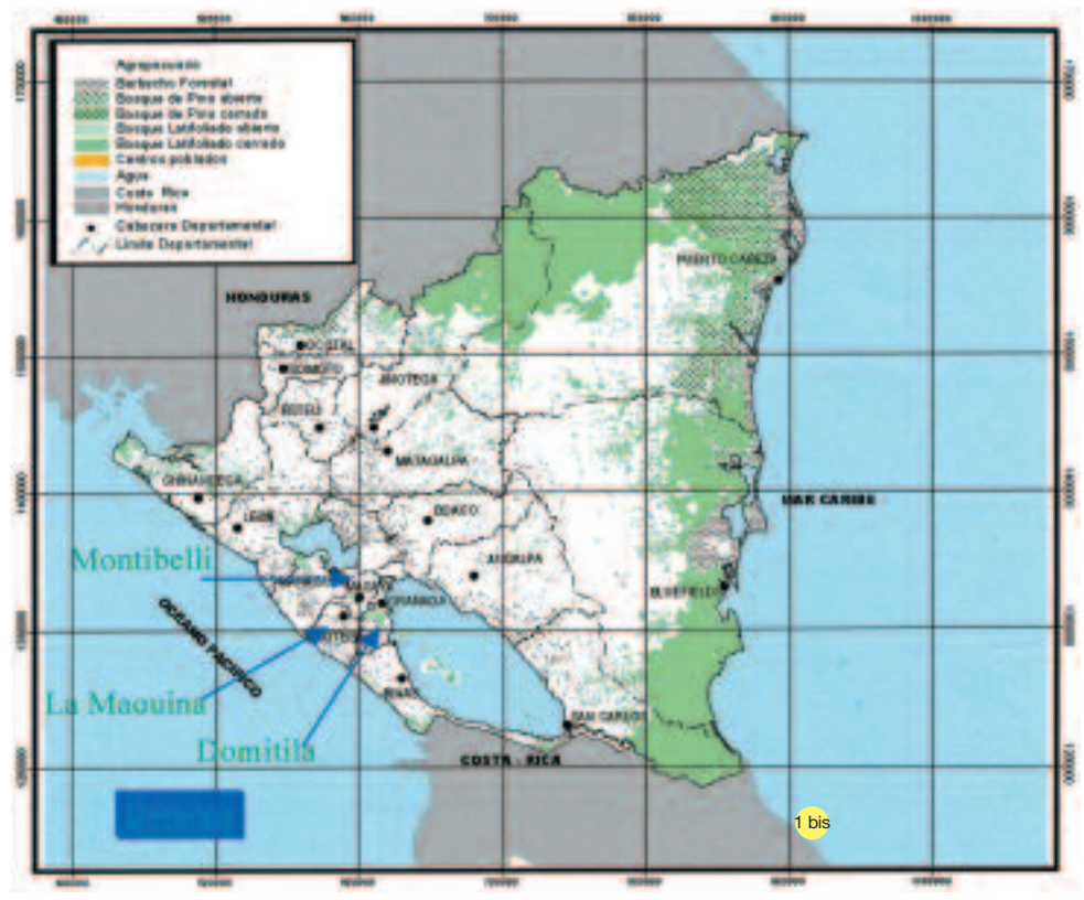
Figuras 1 y 1 bis. Mapa de las áreas privadas (1) en Nicaragua; mapa de uso de la tierra 2003 (1 bis) y ubicación de las fincas con las experiencias de conservación del bosque seco.

Montibelli está conformada por tres propiedades que antiguamente se dedicaron al cultivo de café bajo sombra. Por diferentes razones el cultivo del café se fue abandonando,