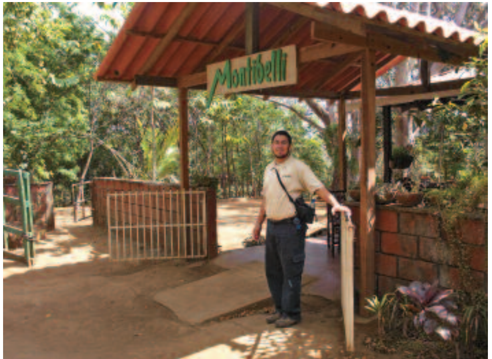
Al igual que Domitila, Montibelli cuenta con guías especializados.

La hipótesis es la siguiente: ¿puede el ecoturismo, en las reservas silvestres privadas, constituir una alternativa económica complementaria para promover la protección y el manejo real de algunas áreas forestales de bosque seco en el Pacífico de Nicaragua?