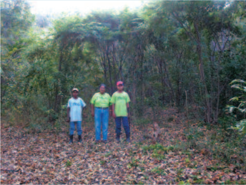
Domitila considera que la conservación de la naturaleza no se puede alcanzar sin el apoyo de la comunidad local.