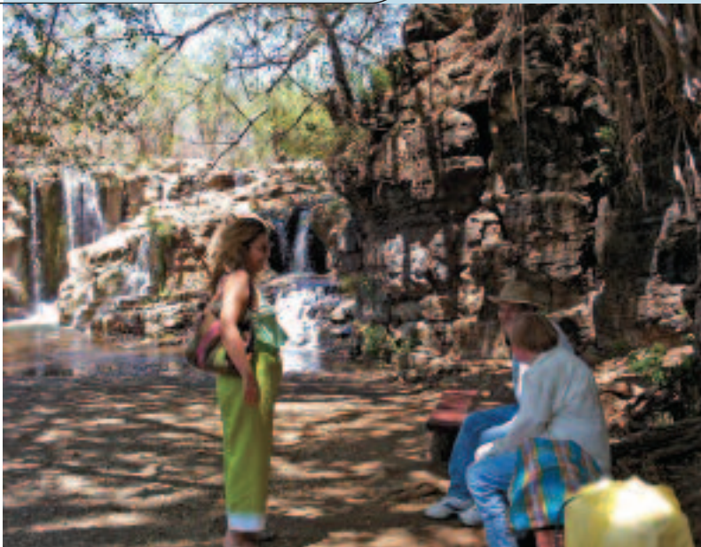
La Máquina considera que el diálogo con los visitantes es de suma importancia.