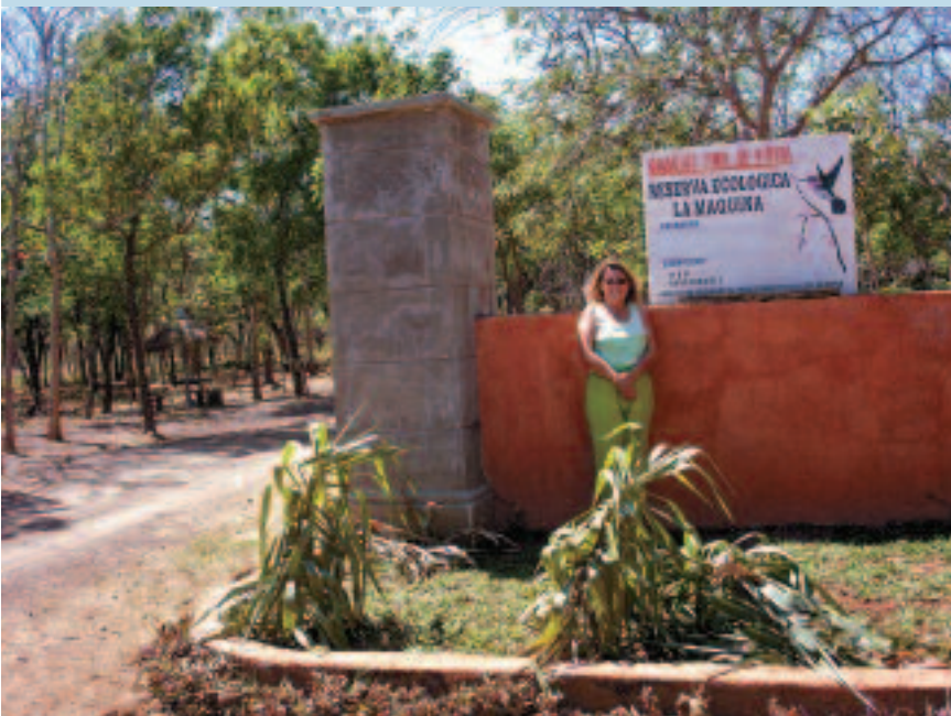
La Máquina le ofrece otros servicios, además de la observación de la belleza escénica.

Alcanzar la sostenibilidad en estas pequeñas áreas de reservas silvestres privadas no será, sin duda, una tarea fácil; por el contrario, puede incluso que se tengan que comprar o integrar nuevas áreas aledañas, como ha ocurrido en la ACG