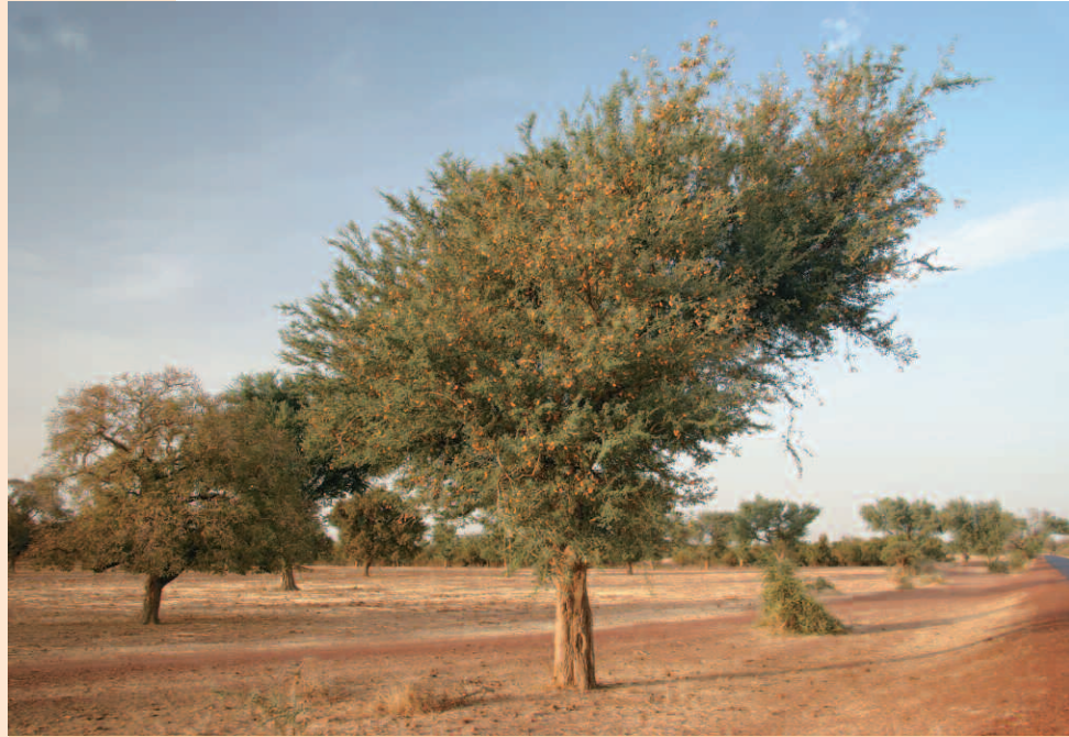
Faidherbia albida , Mali.

Le Réseau d'observatoires de surveillance écologique à long terme, Roselt, contribue à évaluer, pronostiquer et suivre les changements environnementaux. Il fournit un dispositif pérenne de surveillance locale qui alimente les programmes de recherche sur l'environnement et les dispositifs nationaux de surveillance environnementale. Il applique progressivement des méthodes consensuelles et harmonisées de collecte et traitement de l'information environnementale qui permettent d'élaborer des produits communs, comparables dans le temps ou dans l'espace.