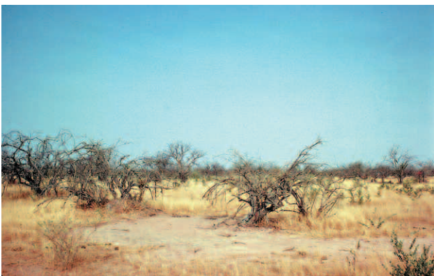
Peuplement de Pterocarpus lucens dégradé par les sécheresses successives et l'émondage par les éleveurs pour nourrir leur bétail (nord du Sénégal).

Le Siel facilite la compréhension de l'état des ressources naturelles sur un territoire local selon une approche spatiale interdisciplinaire (ROSELT/OSS DS3, 2004 c). Il est adapté aux zones sèches caractérisées par de fortes interactions nature/sociétés, une grande variabilité spatiale et temporelle, et des prélèvements simultanés ou successifs des ressources pour divers usages. Il recompose le territoire en unités spatiales stables sur une période pluriannuelle, issues du croisement entre deux plans géographiques construits préalablement. L'un (Sig) cartographie les ressources dans des unités paysagères ( land cover ) ; l'autre (modèles de spatialisation) délimite des unités sur lesquelles s'associent plusieurs pratiques d'exploitation ( land use ). Le Sig exprime le fonctionnement des systèmes écologiques en place à travers leurs intensités de production des ressources (inventaire au sol et images satellitaires) ; le modèle de spatialisation exprime les stratégies des sociétés à travers leurs degrés d'intervention (artificialisation) sur les ressources (enquêtes). Couplant Sig et modèles génériques sur une plate-forme ArcGis, le Siel évalue la vulnérabilité du milieu en exploitant un minimum de données et en calculant des indices synthétiques spatialisés de risque de dégradation des terres. Le changement des paramètres d'entrée produit des cartes prospectives qui facilitent la discussion auprès des gestionnaires des ressources.