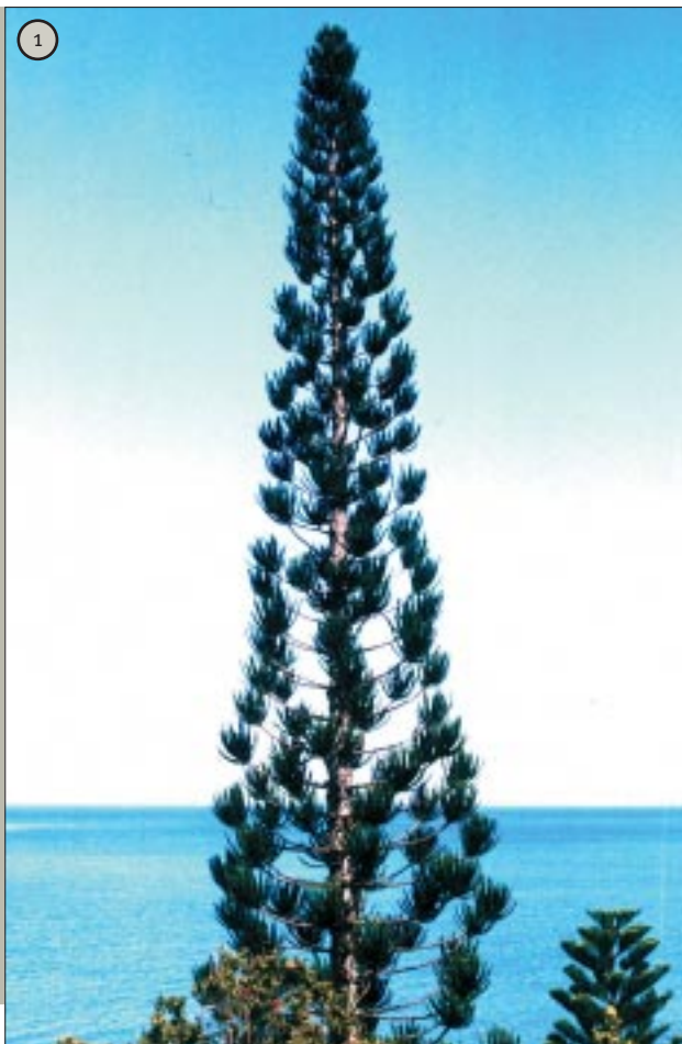
Photo 1. Port d' Araucaria luxurians .

La récolte des cônes femelles a lieu de janvier à février et la pollinisation en juillet. La fructification est régulière et abondante chaque année.