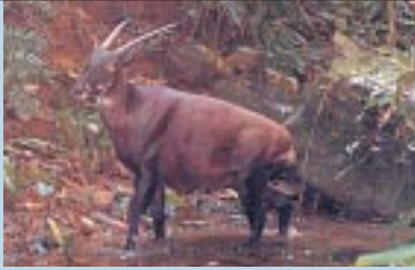
Photo 4. Saola. Saola.

Source : Wildlife in Lao PDR, 1999 Status report. Photo W.G. Robichaud/Wcs.