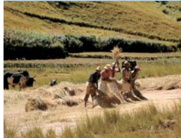
Battage du riz après séchage à proximité du village. Le paddy sera ensaché sur place, le chaume servira à nourrir le bétail, puis sera amené au village. Flailing rice after drying near the village. The rice is then bagged on the spot. The straw will be used to feed animals and the remainder brought to the village for thatch.

En pays bara, les migrants ont, dans un premier temps, assumé un rôle identique à celui des clans bara inférieurs, des riziculteurs installés par les clans royaux dans les zones de bas-fond, dont les villages sont situés à la limite des zones de pâturage et de la forêt. Ce rôle consiste à protéger l'accès aux pâturages et à surveiller la lisière de la forêt (vols de zébus, divagation des bêtes, raids d'ennemis). En échange du droit d'installation et de l'accès au foncier, les clans vassaux versaient la moitié de leur récolte aux suzerains bara qui la convertissaient en cheptel bovin. Les Bara avaient, dans leur majorité, fait le jeu des colons en facilitant l'installation des migrants tout en les contrôlant 7 . Graduellement, il leur devint difficile, du fait de l'absence d'une reconversion vers l'agro-élevage, de résister au dynamisme économique des migrants, agriculteurs performants et innovateurs, et à leur avancée en milieu forestier (production de charbon de bois, exploitation des ligneux, cultures sèches sur brûlis), secteur de leur territoire que les Bara avait négligé au profit de la protection de leurs zones de pâturage.