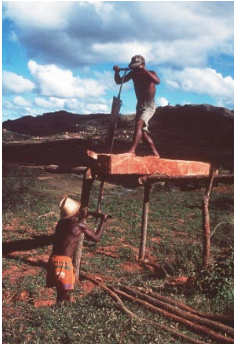
Scieurs de planches d'eucalyptus. Andina, pays betsileo. Sawing eucalyptus planks. Andina, Betsileo region.