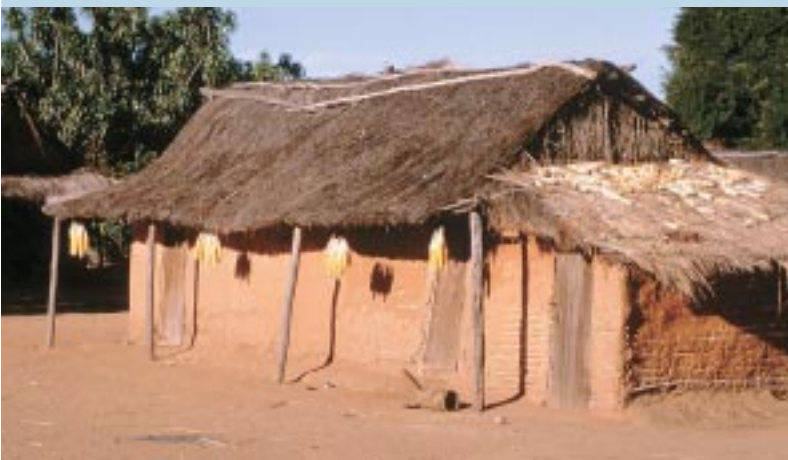
Maison traditionnelle bara avec cuisine attenante. Province de Tuléar. Traditional Bara house with its adjoining kitchen. Tulear Province.

Les Bara ont pendant longtemps assumé le rôle de protecteur de la forêt, grâce à leur statut de tompontany qui leur permettait d'en contrôler l'accès pour d'autres groupes d'origines diverses et d'y limiter les prélèvements et l'extension de l'agriculture sur brûlis, tout en retirant des bénéfices matériels : accroissement du troupeau, pourcentage prélevé sur les récoltes des migrants, extension des réseaux d'alliance et de clientèle. À présent, tout le monde est conscient que les ressources du milieu forestier, jadis perçues comme inépuisables, sont moins abondantes et longues à se renouveler. Malheureusement, cette prise de conscience ne s'accompagne pas d'une diminution des pressions anthropiques sur la sylvie, qui sont, au contraire, aujourd'hui de plus en plus fortes. Les tompontany accusent la colonisation, les exploitants forestiers et les diverses sociétés pétrolières d'être à l'origine de cet état de fait : ils se sont attaqués à la forêt d'une manière brutale, sans prendre en compte les modalités d'accès et les règles d'usage propres à ce milieu, et surtout sans en référer aux Bara. Cette attitude a dérangé les esprits et autres éléments de la surnature qui, pour se venger des Bara ayant mal assumé leur rôle, leur ont retiré leur protection en quittant la forêt. C'est pourquoi, à présent, la forêt est quasi libre d'accès.