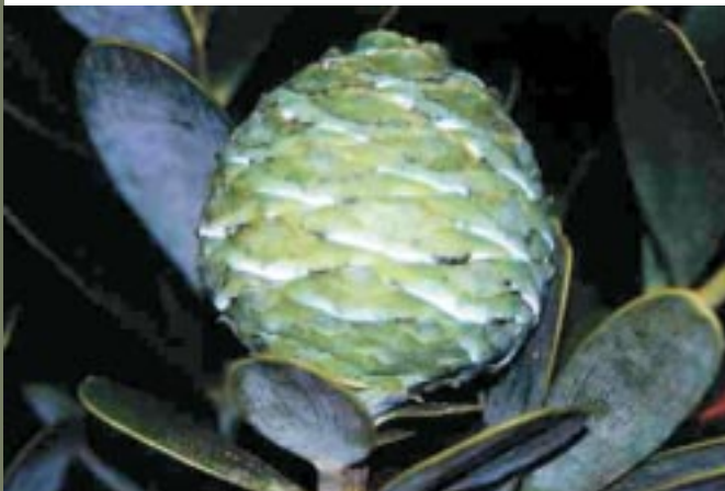
Cône femelle d' A. lanceolata .

La récolte des cônes femelles a lieu de février à mars et la pollinisation en octobre. Le cycle floraison-fructification dure 18 à 20 mois et la fructification est abondante et régulière.