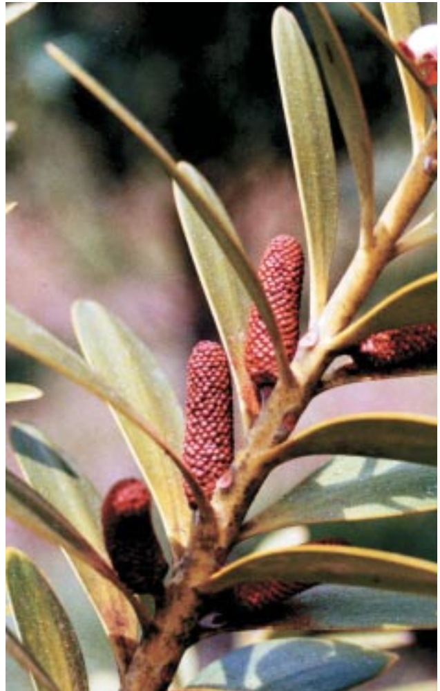
Cône mâle d' A. lanceolata .

Bois d'œuvre, charpentes, bateaux, menuiserie, ébénisterie, revégétalisation de terrains peu dégradés.