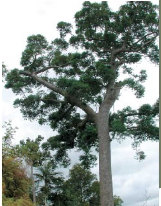
Photo 1. A. corbassonii, port de l'arbre.

L'écorce est de teinte brun à brun rouge, brun rouge chaud en dedans, très rugueuse, granuleuse. Elle se détache en écailles irrégulières. Elle produit une abondante résine blanche (photo 2).