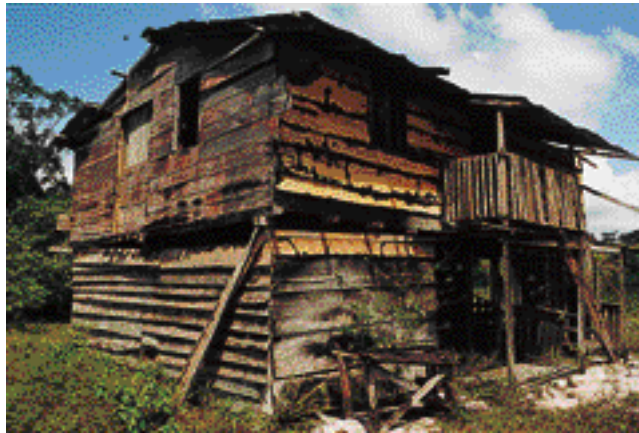
Photo 1. Maison infestée (Guyane). An infested house (French Guiana).

En effet, ces dix dernières années, les infestations par les termites ont pris en France mé-