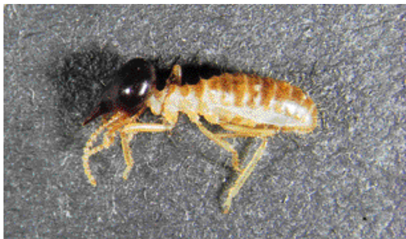
Photo 4. Soldat de Nasutitermes (Guadeloupe). Nasutitermes soldier (Guadeloupe).

Les Nasutitermes constituent un véritable réseau de cordonnet (avec de nombreux nids intermédiaires situés en hauteur, sous les plafonds, en haut de poteaux d'angles et dans les arbres). Cette organisation rend difficile la lutte contre ces espèces.