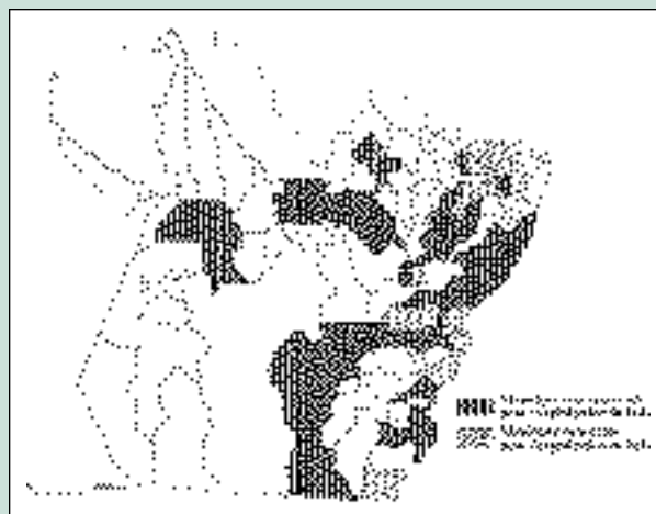
Répartition géographique du bois paraense Geographical distribution of paraense wood