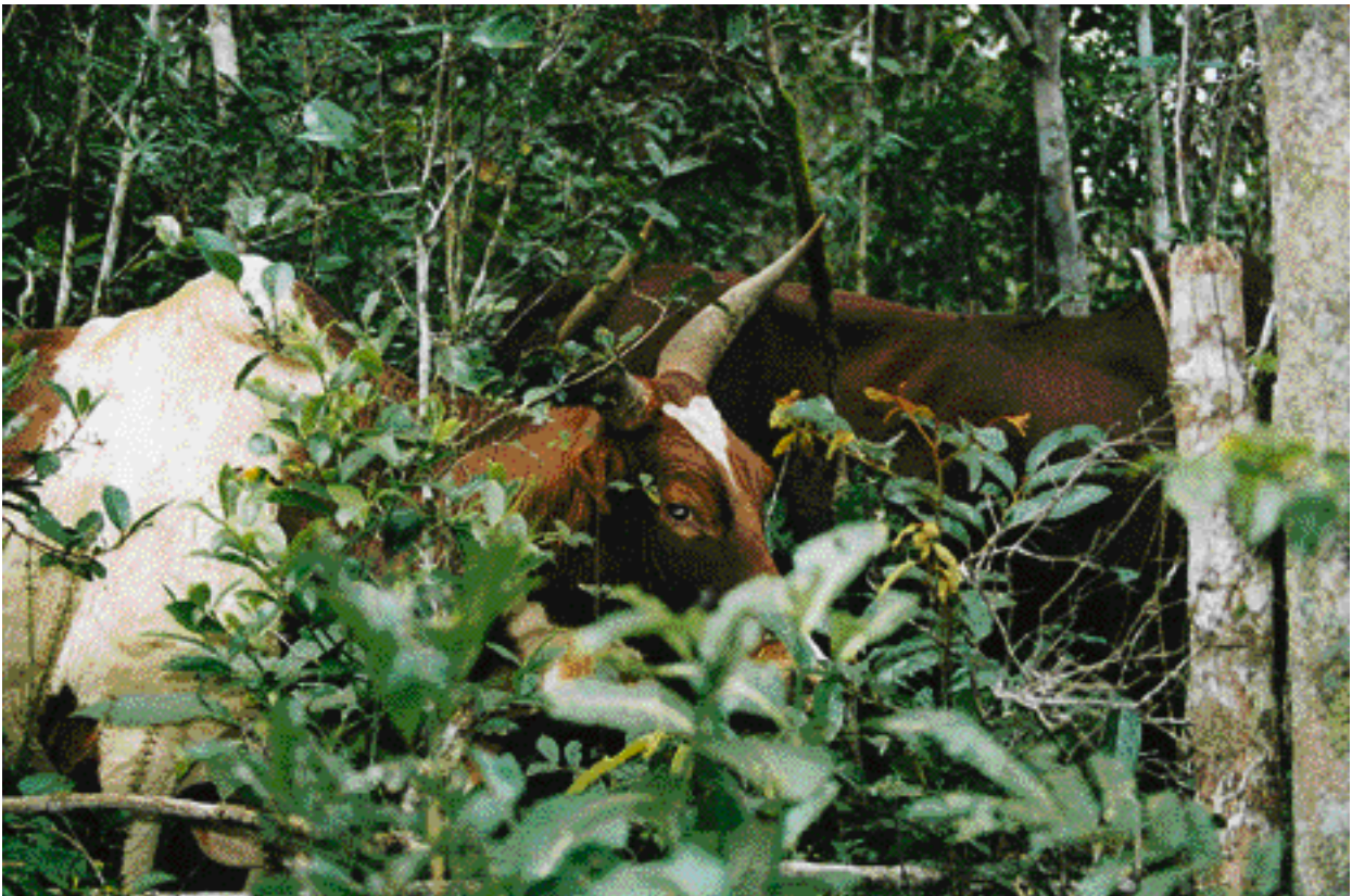
Bœufs pâturant dans un kijana en forêt d'Ambohilero, commune de Didy (Madagascar). Oxen grazing in a kijana in Ambohilers forest, commune of Didy (Madagascar).