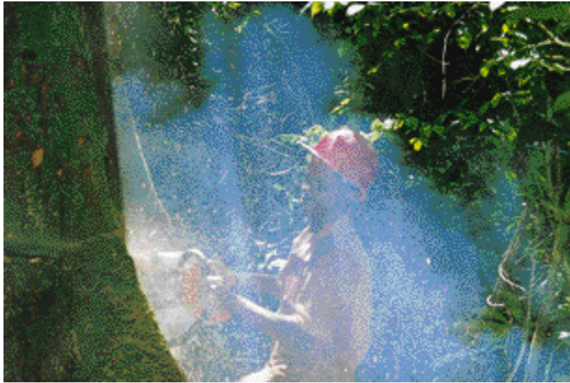
Abattage d'un kevazingo, Guibourtia ehie , en forêt gabonaise (chantier C.F.A. Oguémoué). Felling a kevazingo, Guibourtia ehie, in the Gabonese forest (CFA Oguémoué site).

Déjà la loi forestière de 1982 mettait l'accent sur la nécessité de la « mise en œuvre d'une politique d'aménagement des ressources visant à assurer un meilleur équilibre entre l'exploitation et le renouvellement de la ressource » et d'une politique de « reconstitution des ressources en vue d'assurer leur pérennité ». La nouvelle loi forestière en projet va plus loin sur deux plans :