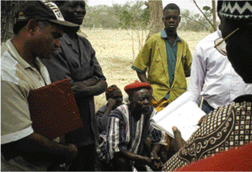
Aménager la forêt c'est négocier les règles d'accès et les usages. Ici, une discussion dans un village, au Burkina-Faso. Negotiating rules of access and forest use is a management factor. Here, negotiations in a village in Burkina-Faso.

Dans ces conditions aménager un massif forestier signifiera chercher à définir pour les divers espaces constituant ce massif des objectifs spécifiques d'affectation. Pour chacun de ces espaces constitutifs, on définira une combinaison d'objectifs à long, moyen et court terme : par exemple, conservation de la biodiversité et exploitation du bois d'œuvre ou, ailleurs, cueillette, chasse, écotourisme et exploitation forestière, etc.