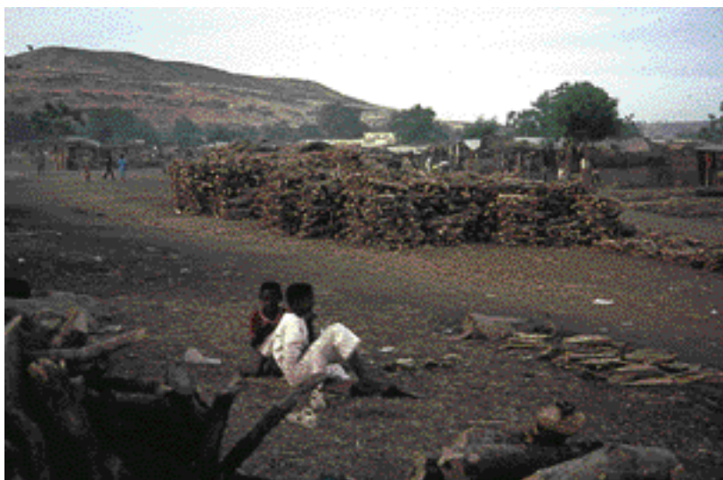
Marché du bois de feu aux environs de Bamako (Mali). Fuelwood market on the outskirts of Bamako (Mali).

Les nouvelles politiques forestières (baptisées Stratégie Energie Domestique) définies à partir de 1989 au