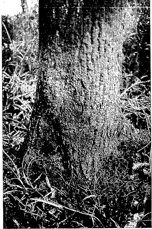
Base de l'arbre