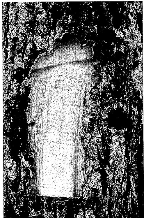
Entaille de l'écorce