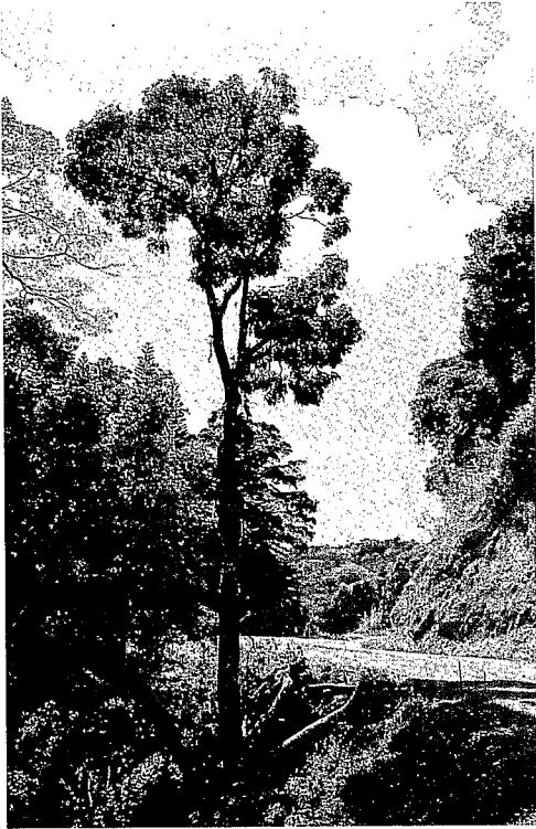
Geissois racemosa Labill.