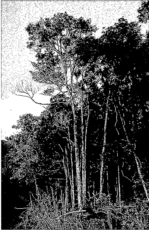
Archidendropsis granulosa Nielsen