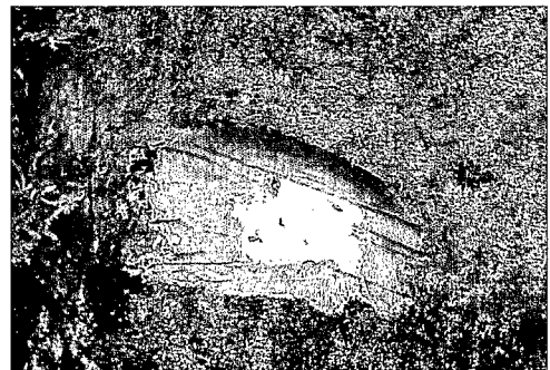
Entaille de l'écorce