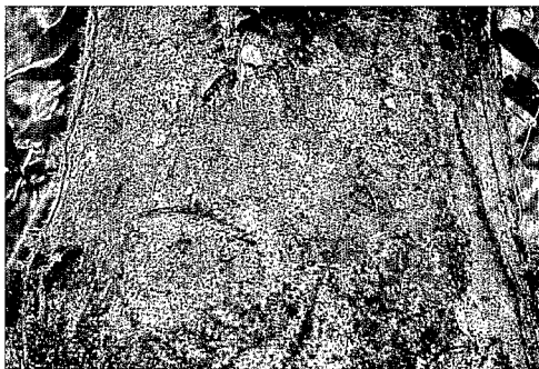
Aspect de l'écorce