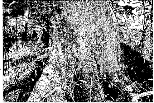
Base du tronc