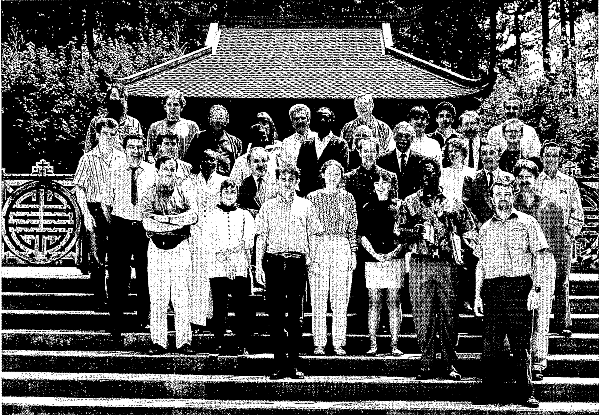
Moments de détente pour les participants à l'Atelier sur les « Symbioses Acacias », devant le pagodon du jardin tropical, au CIRAD-Forêt à Nogent-sur-Marne.

A few moments' relaxation for the members of the Acacia Symbiosis workshop standing in the tropical gardens of CIRAD-Forêt, Nogent-sur-Marne.