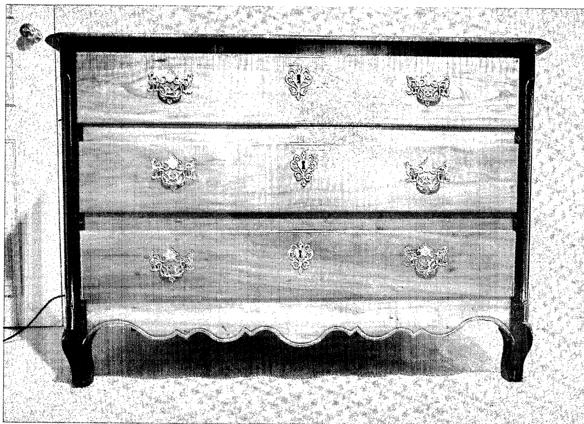
Commode en Balata avec montants en ébène.