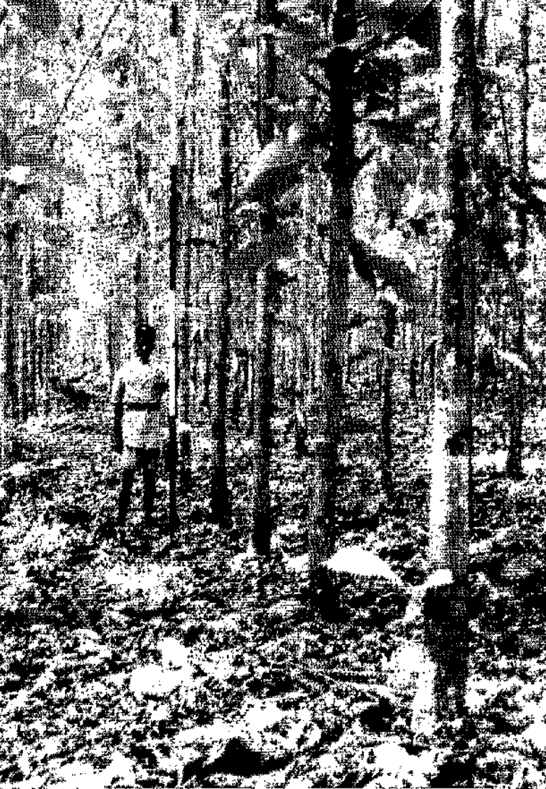
Forêt de Bamoro (Côte-d'Ivoire) Plantation du Teck âgée de 5 ans sur bon sol.