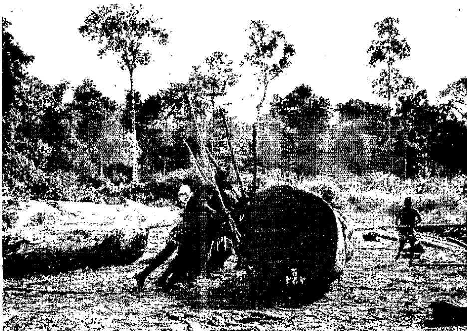
Chargement à bras de wagon Decauville.

Pour terminer, précisons que le code forestier du Gabon a cherché à suivre, en l'orientant dans un sens favorable, l'évolution de la politique forestière. Ses principes de base sont ceux en usage dans tous les pays tropicaux où se pratique une « cueillette » extensive des arbres de valeur. Ce code n'a pas été conçu par des juristes abstraits mais par des techniciens qui ont cherché, peut-être parfois au prix d'une certaine complication, à pousser la corporation forestière dans la voie de l'expansion.